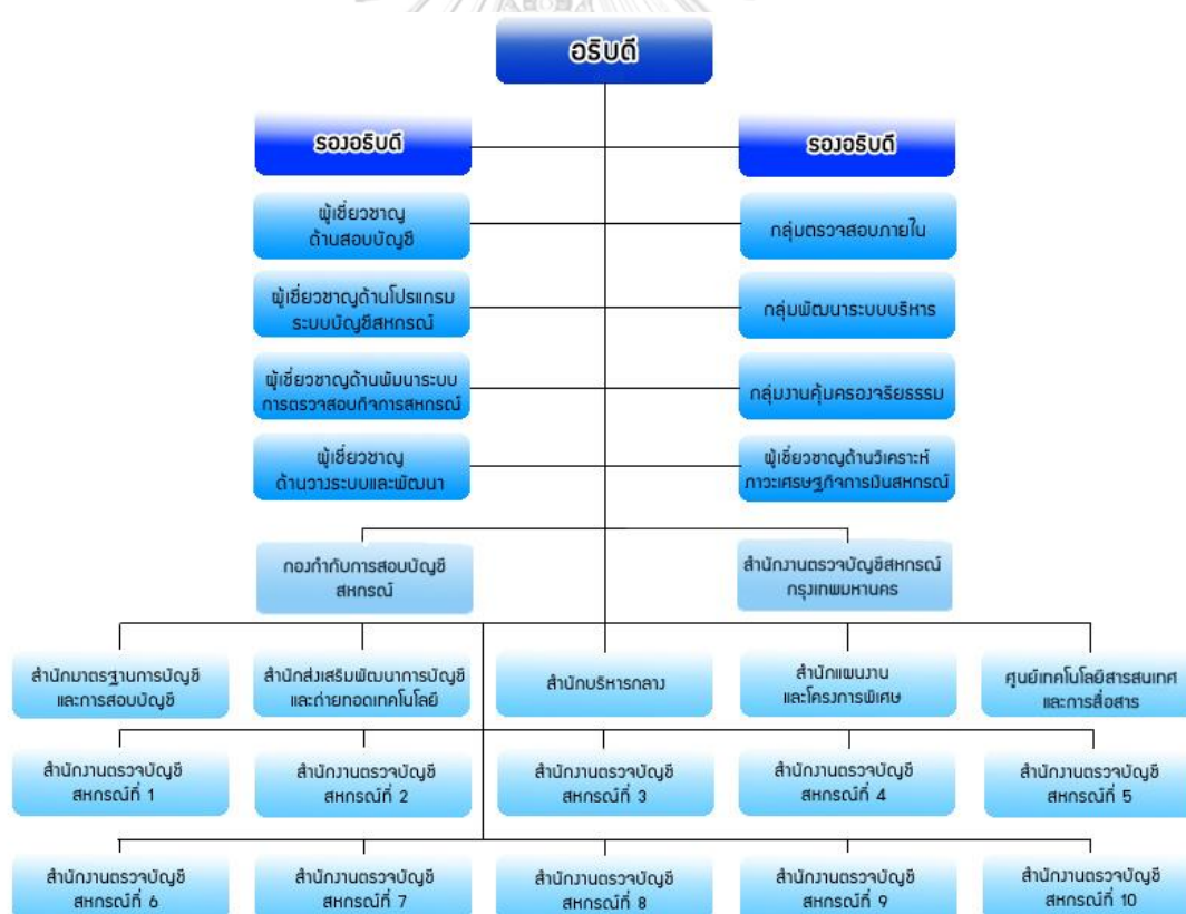
ภาพที่ 1 แสดงโครงสร้างกรมตรวจบัญชีสหกรณ์

โครงสร้างองค์การกรมตรวจบัญชีสหกรณ์ 1 ประกอบด้วย อธิบดี รองอธิบดี ผู้เชี่ยวชาญ กลุ่มพัฒนาระบบบริหาร กลุ่มตรวจสอบภายใน ซึ่งเป็นหน่วยงานสนับสนุนการบริหารราชการของ กรมตรวจบัญชีสหกรณ์ มีหน่วยงานระดับสำนัก/ศูนย์ ตามโครงสร้างการแบ่งส่วนราชการกรมตรวจบัญชีสหกรณ์ ดังต่อไปนี้ (1) สำนักบริหารกลาง (2) สำนักมาตรฐานการบัญชีและการสอบบัญชี (3) สำนักแผนงานและโครงการพิเศษ (4) สำนักส่งเสริมพัฒนาการบัญชีและถ่ายทอดเทคโนโลยี (5) ศูนย์เทคโนโลยีสารสนเทศและการสื่อสาร (6) กองกำกับการสอบบัญชีสหกรณ์ (7) สำนักงานตรวจบัญชีสหกรณ์กรุงเทพมหานคร และมีหน่วยงานส่วนกลางในภูมิภาค ประกอบด้วย สำนักงานตรวจบัญชีสหกรณ์ที่ 1 – 10