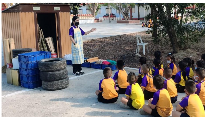
แผนภาพที่ 4 ครูกระตุ้นให้เด็กช่วยกันสร้างข้อตกลง