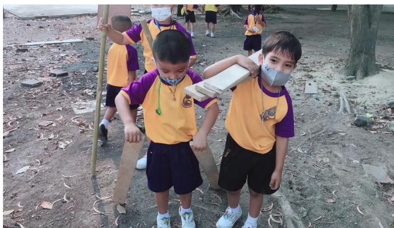
แผนภาพที่ 12 เด็กช่วยกันเก็บอุปกรณ์หลังได้ยินสัญญาณ

ขั้นที่ 4 การให้เด็กเก็บอุปกรณ์ ครูให้สัญญาณการหยุดเล่นเพื่อให้เด็กเก็บวัสดุอุปกรณ์ลูสพารตส์ และทำความสะอาดร่างกาย หลังจากนั้นครูและเด็กร่วมกันแลกเปลี่ยนความคิดเห็น ครูทำหน้าที่ใช้คำถามกระตุ้นความคิดเด็ก โดยครูใช้คำถามว่า “เด็ก ๆ ได้เก็บของเล่นครบทุกคนหรือไม่” และ “การเล่นเมื่อ สักครู่นี้เด็ก ๆ ค้นพบ อะไรบ้าง”