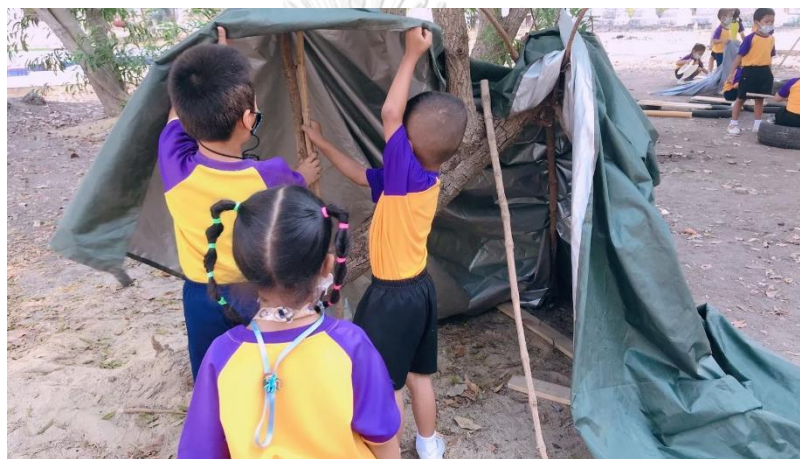
แผนภาพที่ 10 เด็กรับฟังความคิดเห็นของเพื่อนที่เพื่อนแนะนำว่าต้องใช้ไม้ค้ำ 2 อัน