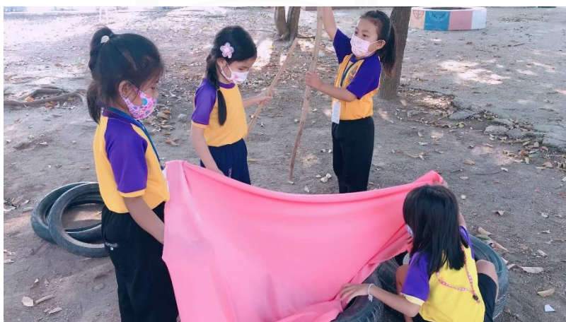
แผนภาพที่ 11 เด็กพบปัญหาว่าผ้ามีขนาดเล็กเกินไป จึงร่วมกันตัดสินใจในการเปลี่ยนอุปกรณ์จากผ้าเป็นผ้าใบ