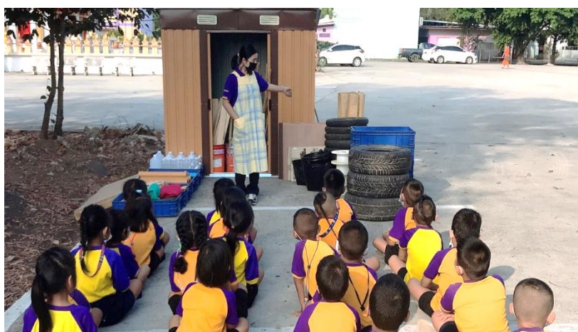
แผนภาพที่ 5 ครูแนะนำอุปกรณ์

ขั้นที่ 2 การให้เด็กสำรวจอุปกรณ์ ครูจัดเตรียมอุปกรณ์ให้เด็กสำรวจ และครูแนะนำอุปกรณ์ ให้เด็กแบ่งการเล่นร่วมกันเป็นกลุ่มย่อย โดยครูกระตุ้นให้เด็กระดมสมองในการตั้งเป้าหมายการเล่นร่วมกัน ครูทำหน้าที่ใช้คำถามกระตุ้น โดยครูใช้คำถามว่า “เด็ก ๆ สังเกตเห็นอุปกรณ์อะไรบ้าง” และ “เด็ก ๆ คิดว่าอุปกรณ์เหล่านี้เราจะสามารถนำไปเล่นอะไรได้บ้าง”