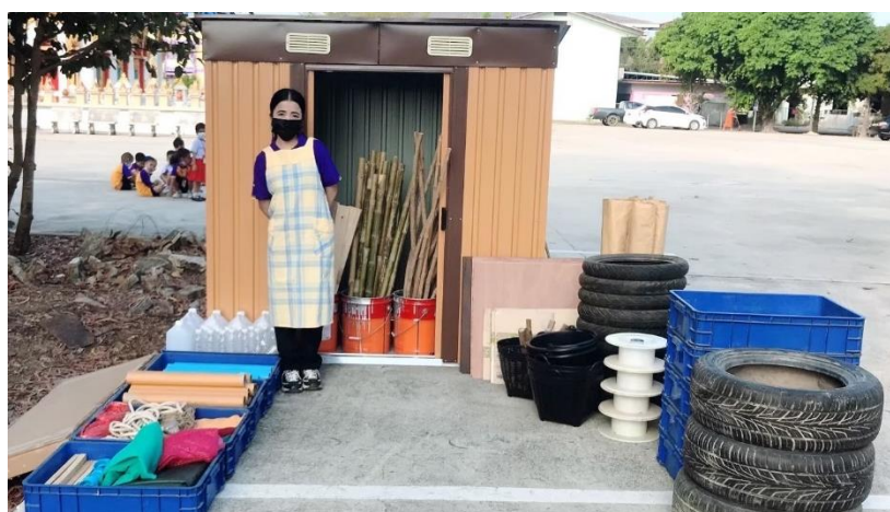
แผนภาพที่ 3 ครูเป็นผู้จัดเตรียมสภาพแวดล้อม สื่อวัสดุอุปกรณ์ลูสพาร์ตส์

ขั้นที่ 1 การเตรียมความพร้อม ครูเป็นผู้จัดเตรียมสภาพแวดล้อม สื่อวัสดุอุปกรณ์ ลูสพาร์ตส์ แนะนำหัวเรื่องของการเล่นให้กับเด็ก และสร้างข้อตกลงร่วมกับเด็กก่อนการเล่น โดยครูกระตุ้นให้เด็กช่วยกันสร้างข้อตกลง ครูทำหน้าที่ใช้คำถามกระตุ้น โดยครูใช้คำถามว่า “กิจกรรมการเล่นในวันนี้เด็ก ๆ คิดว่าเราควรมีข้อตกลงอะไรบ้าง”