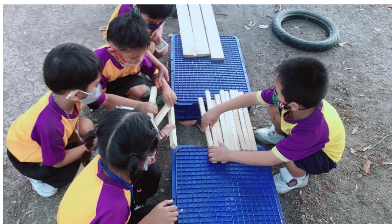
แผนภาพที่ 7 เด็กแบ่งปันอุปกรณ์ของกลุ่มตนเอง ให้กับเพื่อนต่างกลุ่ม

ขั้นที่ 3 การเล่นร่วมกัน ครูเข้าไปร่วมเล่นกับเด็ก ให้เด็กเล่นร่วมกันตามเป้าหมายที่เด็กตกลงร่วมกัน ครูทำหน้าที่อำนวยความสะดวกและช่วยเหลือเมื่อเด็กต้องการ ครูทำหน้าที่ใช้คำถาม กระตุ้นความคิดเด็ก โดยครูใช้คำถามว่า “เด็ก ๆ ได้ทำตามเป้าหมายที่ตกลงร่วมกันหรือไม่ ได้ช่วยกันทำหรือไม่ แล้วใครทำอะไรบ้าง”