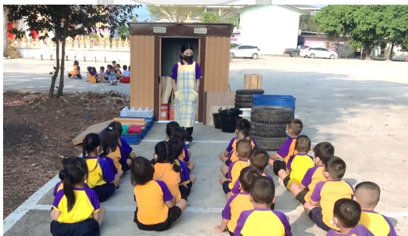
แผนภาพที่ 13 ครูและเด็กร่วมกันแลกเปลี่ยนความคิดเห็น