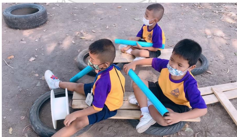
แผนภาพที่ 8 เด็กรอกอย่างรยยนต์จากเพื่อนต่างกลุ่ม