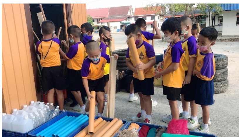
แผนภาพที่ 6 เด็กสำรวจอุปกรณ์ และแบ่งกลุ่มการเล่นร่วมกันเป็นกลุ่มย่อย