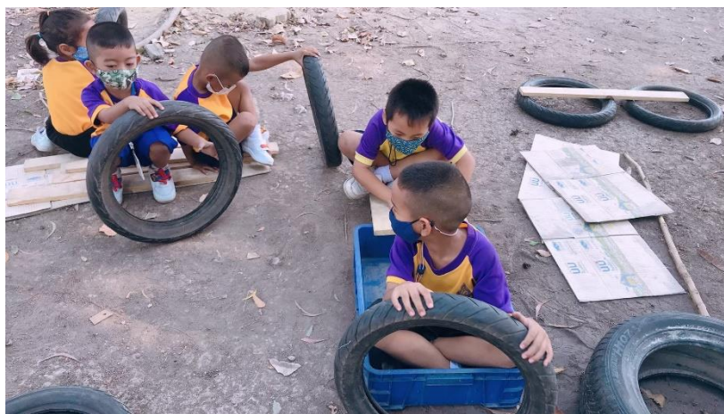
แผนภาพที่ 9 เด็กเจรจาต่อรองกับเพื่อนต่างกลุ่มในการผลิตกันเล่นผลงานของกันและกัน