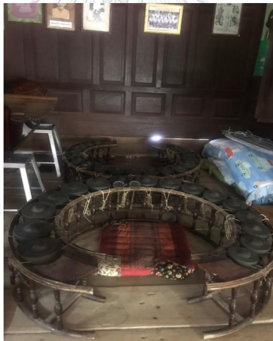
ภาพที่ 18 ฆ้องวงใหญ่ และฆ้องวงเล็กสมัยครูไพฑูรย์ จรรย์นาฎย์ ปัจจุบันยังคงไว้สำหรับต่อเพลง