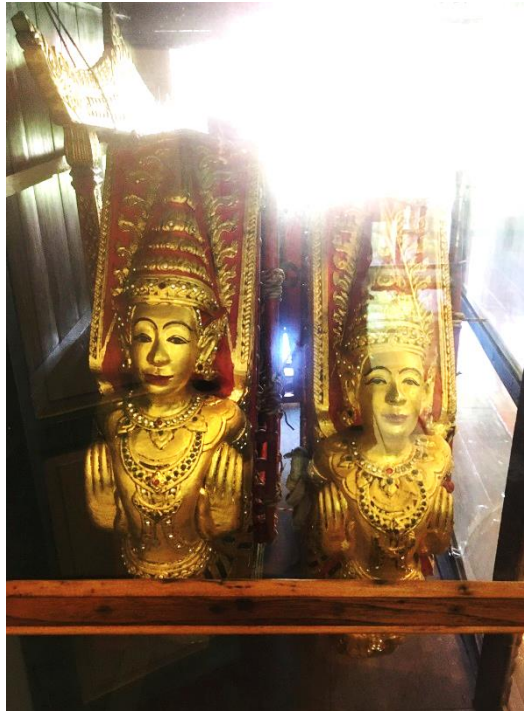
ภาพที่ 7 หน้าพระซ็องมอญที่สร้างจากร้านตุ๊กตาไทย ที่มาภาพ: ตินณภาพ ถนอมธรรม บันทึกภาพเมื่อวันที่ 2 กันยายน 2563