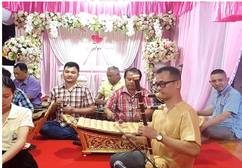
ภาพที่ 39 วงปี่พาทย์คณะลูกครูไพฑูริย์ จรรย์นาฎย์ กำลังบรรเลงปี่พาทย์ผสมเครื่องสายในงานมงคล