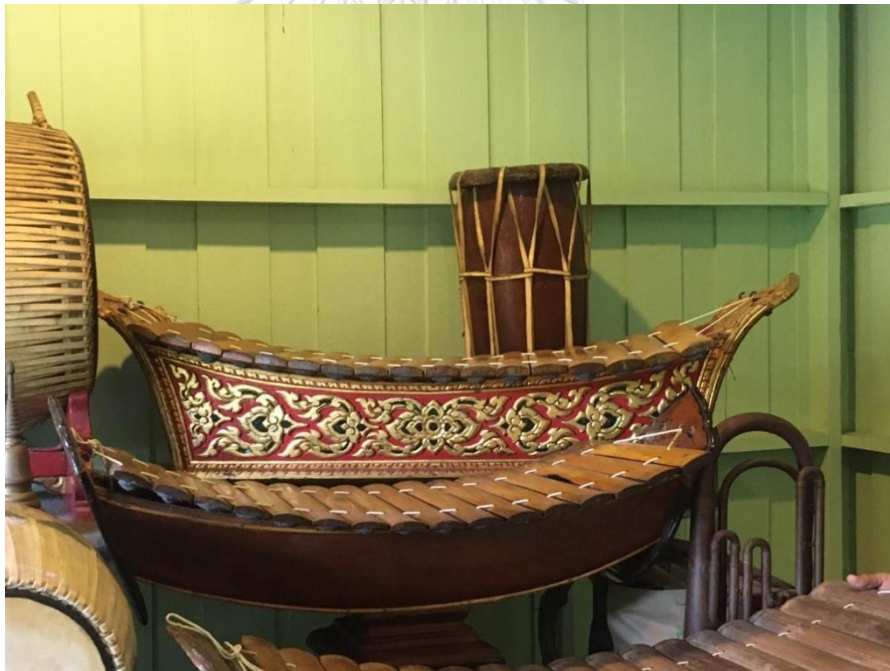
ภาพที่ 14 รวงระนาดทุ้มไม้สักปิดทองเก่าที่ครูไพฑูรย์และลูกศิษย์สร้างขึ้น และรวงระนาดทุ้มมโหรี สมัยครูไพฑูรย์ จรรย์นาฎย์

ที่มาภาพ: ตติณณภพ ถนอมธรรม บันทึกภาพเมื่อวันที่ 15 กันยายน 2563