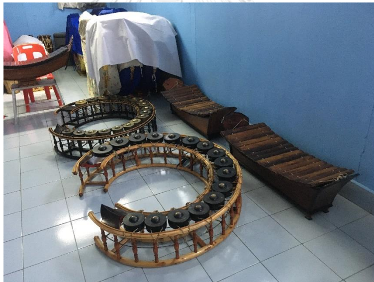
ภาพที่ 20 เครื่องเป็พาทย์ไทย บ้านวัดจอมเกษ บันทึกภาพเมื่อวันที่ 15 กันยายน 2563