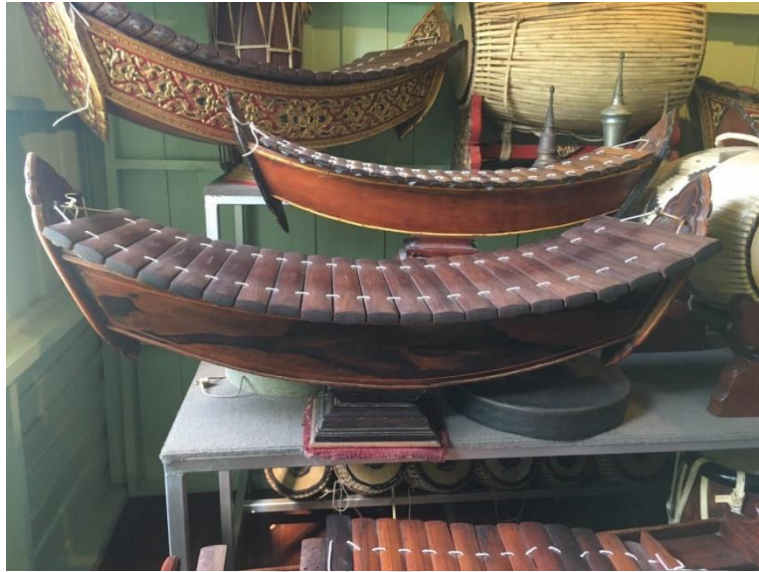
ภาพที่ 15 รางระนาดเอกไม้มะริดและรางระนาดเอกมโหรีสมัยครูไพฑูรย์ จรรย์นาฎย์ ที่มาภาพ: ตติณณภาพ ถนอมธรรม บันทึกรูปเมื่อวันที่ 15 กันยายน 2563