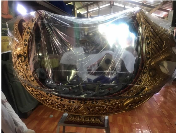
ภาพที่ 19 ช้องวงใหญ่มอญไว้สำหรับต่อเพลง บันทึกภาพเมื่อวันที่ 15 กันยายน 2563