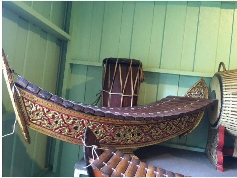
ภาพที่ 13 รวงระนาดเอกไม้สักปิดทองเก่าที่ครูไพฑูรย์และลูกศิษย์สร้างขึ้น ที่มาภาพ: ตติณณภพ ถนอมธรรม บันทึกภาพเมื่อวันที่ 15 กันยายน 2563