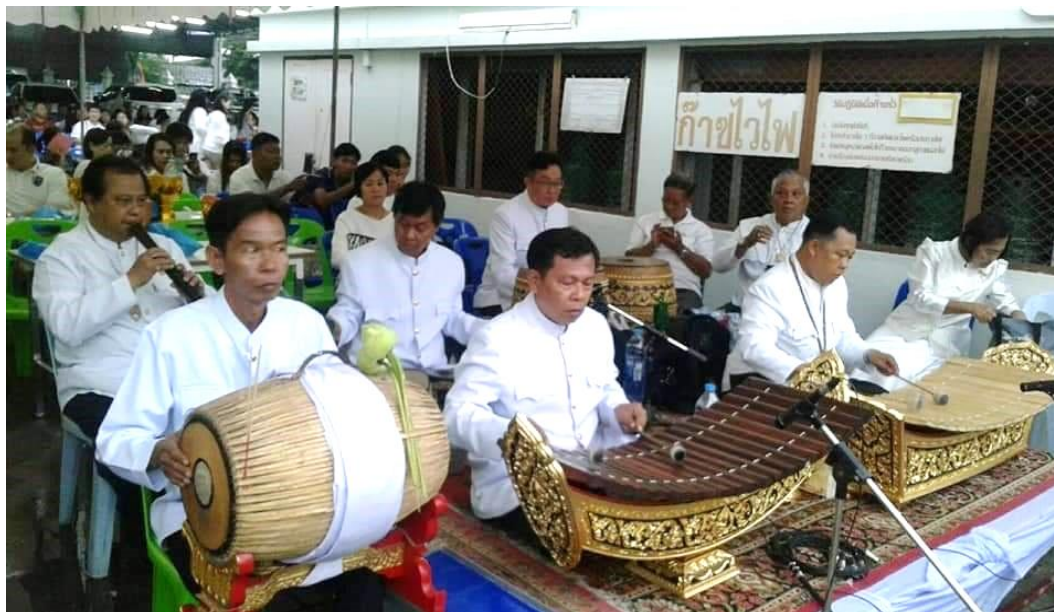
ภาพที่ 24 วงปี่พาทย์คณะลูกครุไพฑูรย์ จรรย์นาฎย์

วงปี่พาทย์คณะลูกครุไพฑูรย์ จรรย์นาฎย์ มีลูกหลานช่วยกันดูแลและอนุรักษ์พร้อมทั้งเผยแพร่ผลงานและทางเพลงของครูเพชร จรรย์นาฎย์ และเพลงของครูไพฑูรย์ จรรย์นาฎย์ ยังคงมีอยู่จนถึงทุกวันนี้ พร้อมกันนั้นลูกหลานยังได้ประพันธ์เพลงใหม่ ๆ ไว้ใช้ในวงอีกด้วย และยังรับงานบรรเลงต่าง ๆ ทั่วไปอยู่จนถึงทุกวันนี้ คนส่วนใหญ่หรือในหมู่นักปี่พาทย์ทั่วไปจะเรียกกันติดปากว่า “วงจรรย์นาฎย์” วงปี่พาทย์คณะลูกครุไพฑูรย์ จรรย์นาฎย์ ตั้งอยู่บ้านเลขที่ 24/1 หมู่ 2 ใต้วัดจอมเกษ ตำบลขยาย อำเภอบางปะหัน จังหวัดพระนครศรีอยุธยา