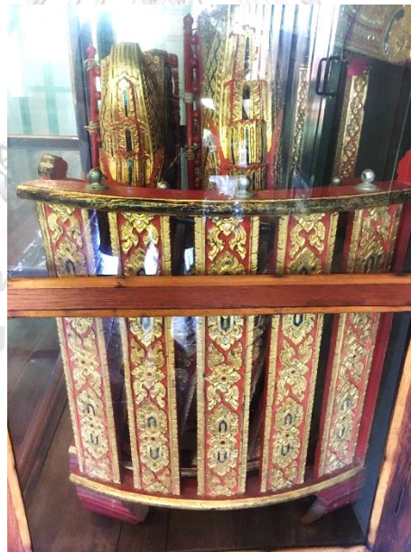
ภาพที่ 10 คอกเปิงมาง เครื่องเก่าสมัยกรุงโพทุรุย์ จรรย๋นาฎย๋ ที่มาภาพ: ตินณภาพ ถนอมธรรม บันทีกภาพเมื่อวันที่ 2 กันยายน 2563