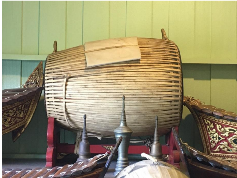
ภาพที่ 9 ตะโพนมอญ เครื่องเก่าสมัยกรุงโพทุรุย์ จรรย๋นาฎย๋ บันทีกภาพเมื่อวันที่ 2 กันยายน 2563