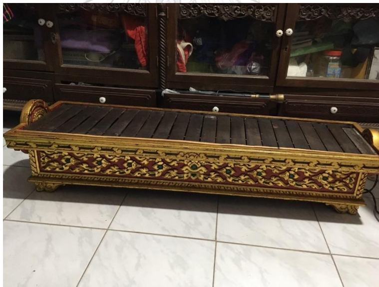
ภาพที่ 16 รางระนาดเอกเหล็กปิดทองสมัยครูไพฑูรย์ จรรย์นาฎย์ บันทึกรูปเมื่อวันที่ 15 กันยายน 2563