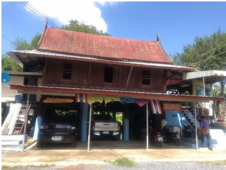
ภาพที่ 6 บ้านของครูไพฑูรย์ จรรย์นาฎย์ (บ้านวัดจอมเกษ)