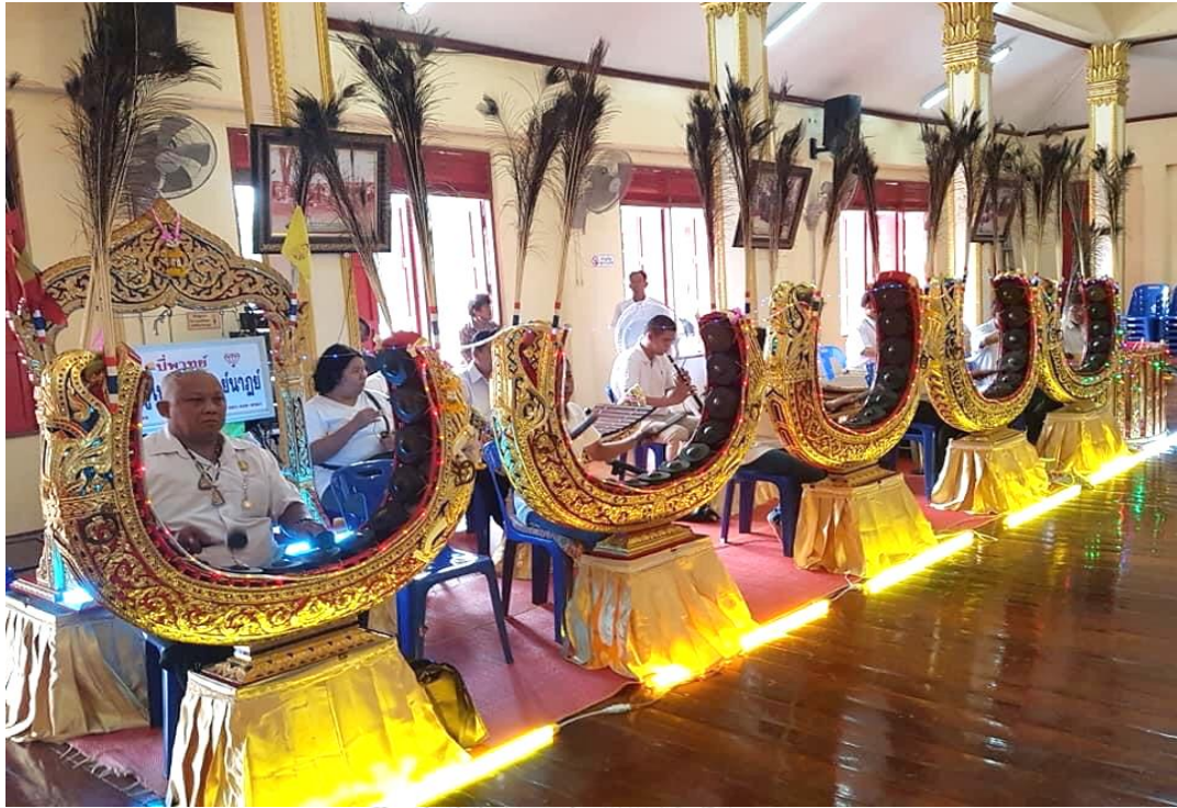
ภาพที่ 22 วงปี่พาทย์มอญคณะลูกครูไพฑูรย์ จรรย์นาฎย์