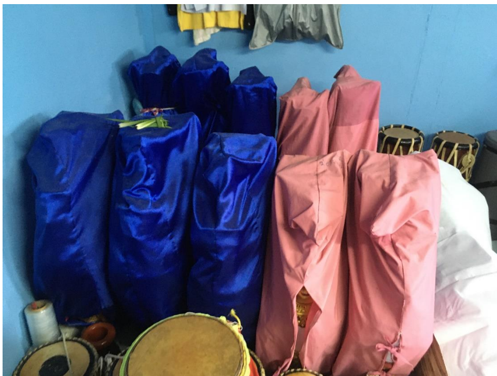
ภาพที่ 21 เครื่องดนตรีสำหรับใช้งานปัจจุบัน บ้านวัดจอมเกษ ที่มาภาพ: ตีณณภาพ ถนอมธรรม บันทึกภาพเมื่อวันที่ 15 กันยายน 2563

ครูพิทักษ์ จรรย์นาถย์ อธิบายเพิ่มเติมเรื่องการรับงานปีพาทย์มอญ ให้ผู้วิจัยฟังว่า สมัยก่อนงานเครื่องมอญจะมีเยอะมาก ถึงกับต้องเอาเครื่องไว้ที่รถเลย ไม่เอาลง เตรียมไว้เผื่อเสร็จงานนี้แล้วไปงานต่อได้เลย ... วัดตะเคียนนี้ทำเป็นว่า เล่นเลย ทุกเสาร์ - อาทิตย์ สามสี่งาน แล้วเขาหากันหลายคืนด้วยนะ ครูสมบัติ สังกะเสนทอง เคยมาร้องเพลงให้ ร้องแทบไม่ได้หยุดเลย บางทีเราเลิกก่อนเวลา ห้านาที่นี้เขาถึงกับบ่นเลย เขาก็โวยวายว่ายังไม่ถึงเวลาเลิกเลย แล้วเขาก็นั่งฟังกัน คนในวงก็จะเป็นชุดเดิมนะ เราก็ไม่ได้เปลี่ยนคนเปลี่ยนอะไรไป นักร้องก็จะมีพี่สมบัติ เจ้าเปี้ยก (กำจรเดช) ณรงค์ รวมบรรเลง แล้วก็มิวิมล เผยเผ่าเย็น คนร้องของ กทม. ก็เคยมา ... สมาชิกวงส่วนใหญ่ก็จะเป็นลูก ๆ แล้วก็มีลูกศิษย์มาช่วยงาน ตอนหลัง ๆ ลูกศิษย์เขาก็เริ่มเสียชีวิตกันไป... (พิทักษ์ จรรย์นาถย์, สัมภาษณ์ 15 กันยายน 2563)