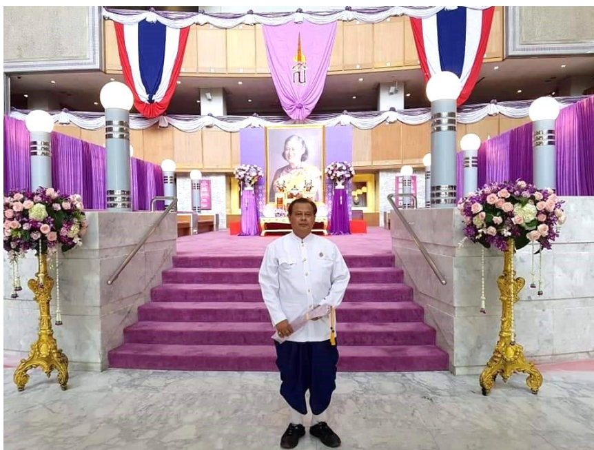
ภาพที่ 26 วงปีพาทย์คณะลูกครูพิทักษ์ จรรย์นาฎย์