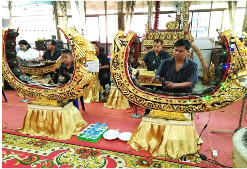
ภาพที่ 36 วงปี่พาทย์คณะลูกครูไพฑูริย์ จรรย์นาฎย์ กำลังบรรเลงปี่พาทย์มอญในงานอวมงคล ที่มาภาพ: ครูพิทักษ์ จรรย์นาฎย์ (ตีพิมพ์ ๓๐ ม.ค. ๒๕๖๓)