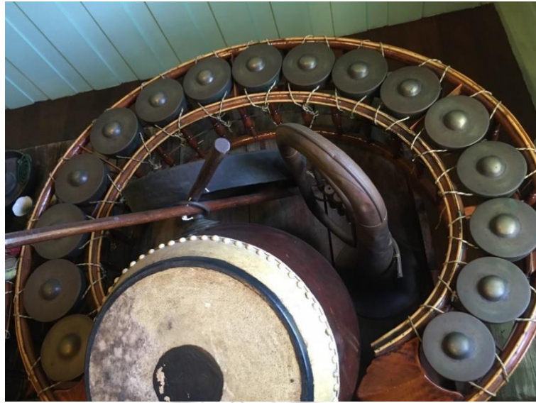
ภาพที่ 17 ฆ้องวงใหญ่ ยูโฟเนียมและกลองทัดสมัยครูไพฑูรย์ จรรย์นาฎย์ ที่มาภาพ: ตติณณภพ ถนอมธรรม บันทึกภาพเมื่อวันที่ 15 กันยายน 2563