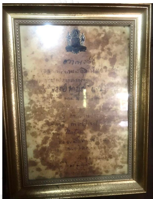
ภาพที่ 3 ลายพระหัตถ์สมเด็จพระเจ้าฟ้าภาณุรังษีสว่างวงศ์ กรมพระยาภาณุพันธุวงศ์วรเดช

ตราตั้งนามสกุลของน้องรัชกาลที่ 5 พระราชทานนามสกุล จรรยาภุช เขียนไว้ให้ ครูเพชร แต่ก่อนสมเด็จพระเจ้าฟ้าภาณุรังษีสว่างวงศ์ กรมพระยาภาณุพันธุวงศ์วรเดชนั้นยังไม่มีนามสกุลใช้นะ ท่านตั้งให้ เขียนว่าประธานให้กับนายเพชร จรรยาภุช แปลว่าประพุดตินตริ ภาษาโรมันเขียนว่าอย่างนี้ เขาก็จะมีเขียนไว้เสร็จเลย มีภาษาอังกฤษด้วยนะ เขียนไว้ว่าขอให้เจริญอย่างนี้ แล้วก็ลงชื่อพระนามไว้ (พิทักษ์ จรรยาภุช, สัมภาษณ์, 26 กันยายน 2563)