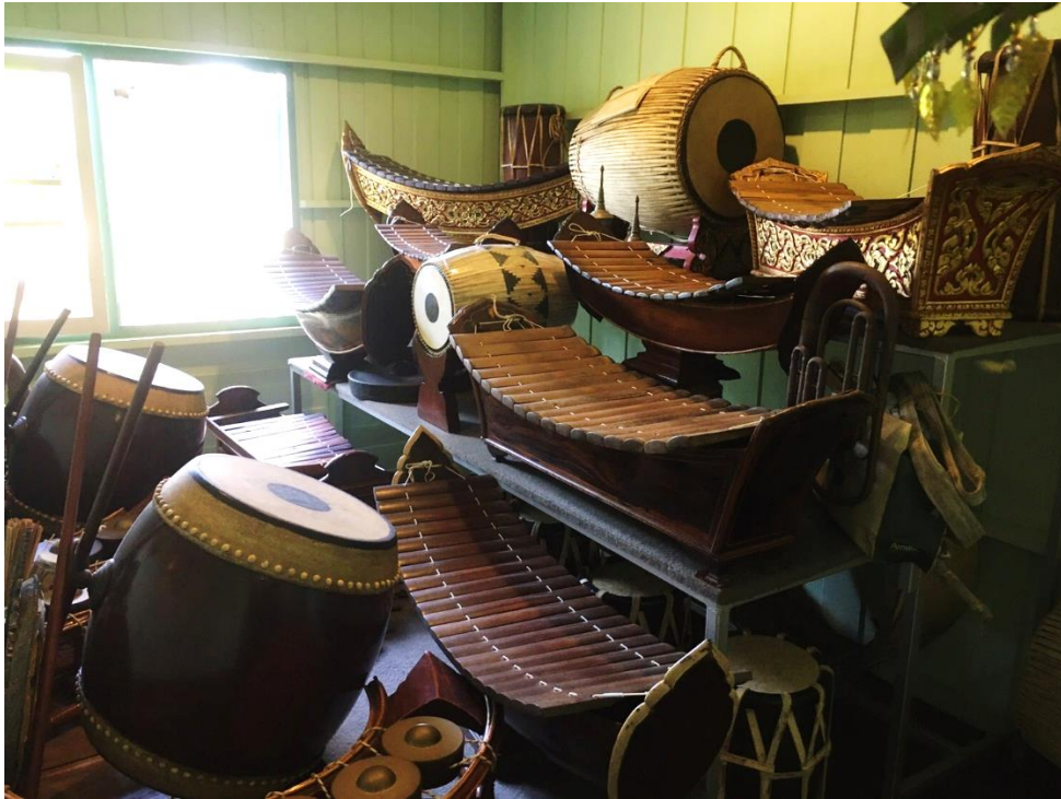
ภาพที่ 11 เครื่องดนตรีเครื่องเก่า บ้านครูเพชร จรรย์นาฎย์ บ้านเหนือวัดสามวิหาร บันทึกภาพเมื่อวันที่ 2 กันยายน 2563