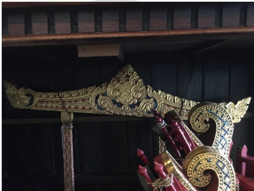
ภาพที่ 12 กระจิ่งโหม่ง บ้านครูเพชร จรรย์นาฎย์ บ้านเหนือวัดสามวิหาร บันทึกภาพเมื่อวันที่ 15 กันยายน 2563