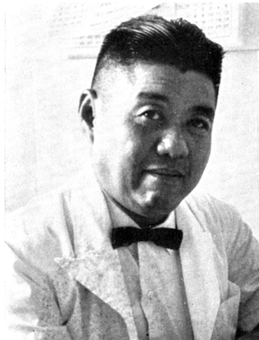
รูปที่ 1. ศาสตราจารย์กิตติคุณ นายแพทย์ สุนิตย์ เจริญศิริวัฒน์

เมื่อ 60 ปีก่อนนิสิตแพทย์และคนไข้ต่างคุ้นเคยกับการเห็นคุณหมอคนช่างท่อม ผูกหูกระต่าย (รูปที่ 1) อารมณ์ดี สอนหนังสือหรือตรวจคนไข้ อยู่ที่ห้องตรวจเล็ก ๆ ที่ชั้นล่าง ตึกจักรพงษ์ คุณหมอนั้นคือ ศาสตราจารย์กิตติคุณนายแพทย์ สุนิตย์ เจริญศิริวัฒน์ ปรมาจารย์ทางโรคผิวหนังของประเทศไทย และคณะแพทยศาสตร์ จุฬาลงกรณ์มหาวิทยาลัย ท่านอาจารย์จบมัธยม 8 จากโรงเรียนอัสสัมชัญ และสำเร็จการศึกษาจากคณะแพทยศาสตร์และศิริราชพยาบาล (ศิริราชรุ่น 53) ท่านอาจารย์ได้ไปศึกษาต่อสาขาโรคเขตร้อนที่เมือง