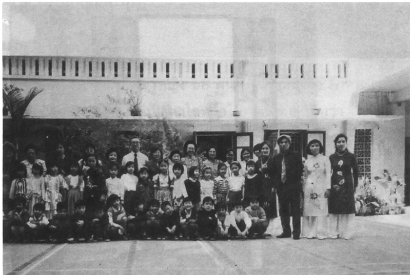
บริเวณโรงเรียน “ทังลอง”

บริเวณโรงเรียนและห้องเรียนคับแคบ ตัวอาคารค่อนข้างเก่า แต่สะอาดสะอ้าน