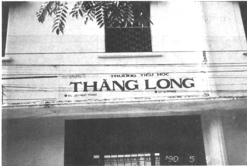
โรงเรียน “ทังลอง” โรงเรียนประถมศึกษาดีเด่นของเวียดนาม

แปลว่า “มังกรบิน” เป็นโรงเรียนที่ได้รับรางวัลการประถมศึกษาดีเด่นของเวียดนาม