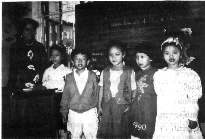
การแต่งกายของนักเรียน

ปกติมีเครื่องแบบนักเรียน ยกเว้นฤดูหนาวที่โรงเรียนให้นักเรียนแต่งตัวตามสบาย หรือ แต่งชุดประจำชาติ (ดังที่เห็นในภาพ)