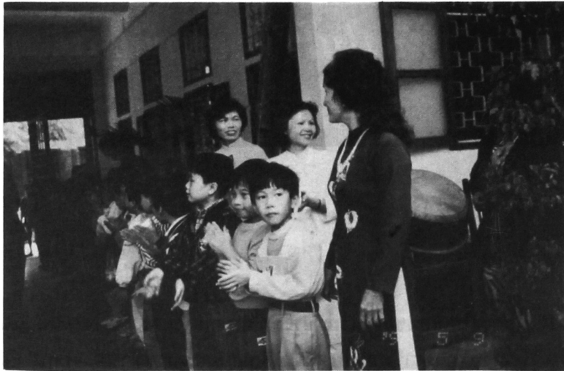
นักเรียนเวียดนาม ต้อนรับแขกผู้มาเยือนโรงเรียน

หลังจากนั้นครูใหญ่และผู้ช่วย ต้อนรับแขกเข้าสู่ห้องประชุมของโรงเรียน แล้วบรรยายสรุปเรื่องราวของโรงเรียนให้เราฟัง ซึ่งจะขอถ่ายทอดไปยังผู้อ่าน ณ ที่นี้