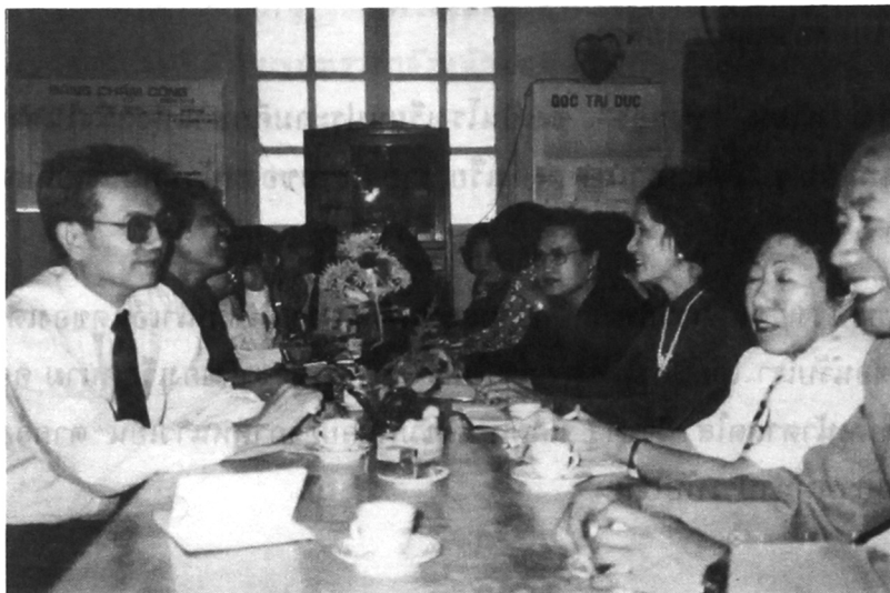
ครูใหญ่กำลังบรรยายสรุปเรื่องราวของโรงเรียน “ทังลอง”

หลังจากนั้นครูใหญ่และผู้ช่วย ต้อนรับแขกเข้าสู่ห้องประชุมของโรงเรียน แล้วบรรยายสรุปเรื่องราวของโรงเรียนให้เราฟัง ซึ่งจะขอถ่ายทอดไปยังผู้อ่าน ณ ที่นี้