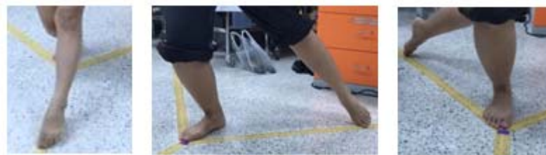
รูปที่ 1. ทดสอบการควบคุมการทรงท่าขณะเคลื่อนไหวทิศด้านหน้า (anterior; ANT) ทิศด้านใกล้กลางด้านหลัง (posteromedial; PM) และทิศด้านข้างด้านหลัง (posterolateral; PL)