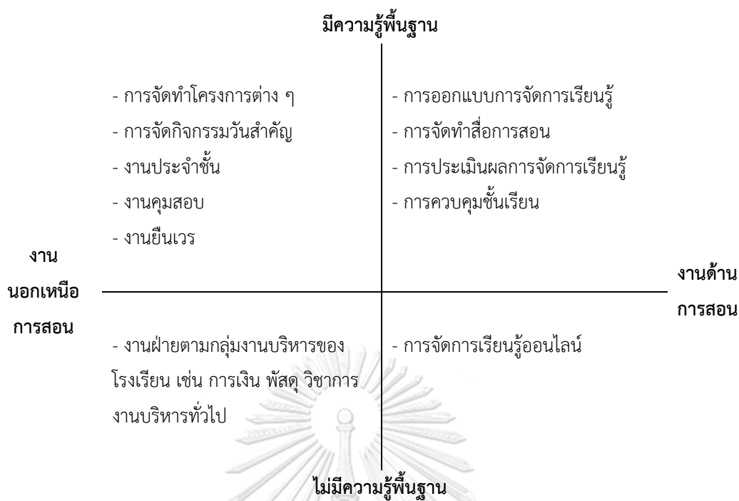
ภาพ 4.1 ภาระงานจำแนกตามมิติด้านความรู้และมิติด้านประเภทของงานของนักศึกษาคูครู