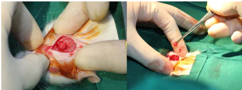
รูปที่ 2. การสร้างรอยวิการบนกะโหลกศีรษะหนู

หนูถูกนำมามาตามด้วยการฉีด Zoletil + Xylazine solution zoletil 50 mg/ml (Virbac animal health, France) 30 mg/kg dose + Seton 2% (Xylazine, Laboratoris Calier, S.A., Barcelona, Spain) 10 mg/kg dose, ฉีดแบบ intra peritoneal จากนั้นให้ยาปฏิชีวนะ Enrofloxacin (Genflaxcin, General Drugs House Co., Ltd.) 10 mg/kg, SC) จากนั้นทำความสะอาดบริเวณที่จะทำการผ่าตัดด้วย 70% ethanol และ Betadine เปิดแผลแบบ full thickness แต่เว้นไม่ขูดส่วนที่เป็นเยื่อหุ้มกระดูกออก เจาะกะโหลกหนด้วยหัวกรอกวง (Trephine bur) เส้นผ่านศูนย์กลาง 4 มิลลิเมตรจะทำให้ได้รอยวิการของกระดูกขนาด 5 มิลลิเมตร (เส้นผ่านศูนย์กลางรอบนอก 5 มิลลิเมตร) (11-13) จากนั้นใช้คีมหนีบขึ้นกระดูกออกและทำการห้ามเลือดด้วย ผ้าก๊อช แล้ววางชิ้นงานขนาด 5 มิลลิเมตร ลงในรอยวิการบนกะโหลกศีรษะหนู ยึดชิ้นงานกับเยื่อหุ้มกระดูกด้วยไหมไนลอน (Prolene 6-0) แล้วทำการเย็บปิดแผล