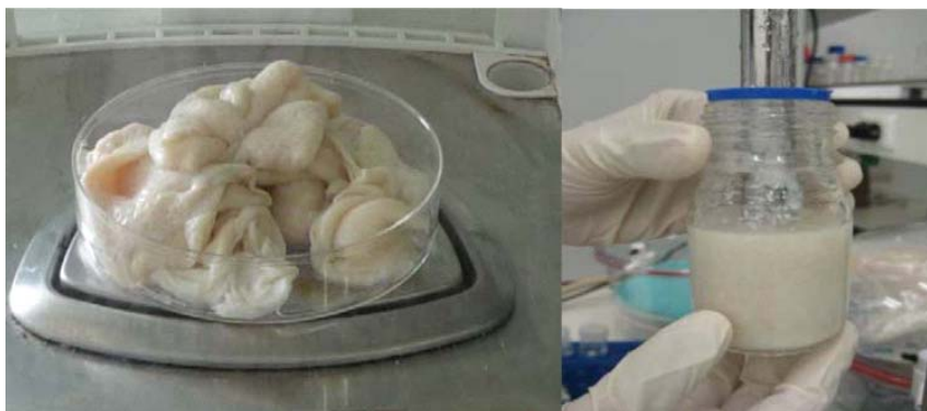
รูปที่ 1. สารสกัดจากผิวหนัง

จากนั้นเตรียมจากสารละลายคอลลาเจนชนิดที่ 1 (Collagen type I) ความเข้มข้นร้อยละ 0.8 โดยมวล/ปริมาตร (ในสารละลายกรดแอสติก ความเข้มข้น 0.05 โมลาร์) โดยใช้คอลลาเจนชนิดที่ 1 จากบริษัท Sigma-Aldrich corporation เนื่องจากเป็นคอลลาเจนที่นิยมใช้ในการเตรียมโครงเนื้อเยื่อสังเคราะห์ในงานด้านวิศวกรรมเนื้อเยื่อ ลักษณะของสารละลายคอลลาเจนชนิดที่ 1 ที่เตรียมได้มีลักษณะเหนียวหนืดเกาะกันเป็นก้อน สีไม่มีสี ใสกว่าสารสกัดจากผิวหนัง นำสารสกัดจากผิวหนังมาขึ้นรูปโดยทำการขึ้นรูปทั้งแบบ ผสมผงกระดูกและไม่ผสมผงกระดูกเช่นเดียวกับสารละลายคอลลาเจนชนิดที่ 1 ทำให้ได้โครงเลี้ยงเซลล์ที่มีความแตกต่างกัน 4 สูตร ในส่วนของ sample ทำการผสมผงกระดูกลงในสารสกัดจากผิวหนัง ในอัตราส่วน น้ำหนักแห้งของสารสกัดจากผิวหนัง: ผงกระดูก เท่ากับ 60 : 40 ถูกนำมาเตรียมเป็นโครงเนื้อเยื่อสังเคราะห์โดยการฉีดวัตถุดิบแต่ละชนิดเข้าสู่แม่แบบขึ้นรูป (Mould) จากเหล็กกล้าไร้สนิม (Stainless steel) รูปทรงสี่เหลี่ยม ร่องลึก 2 มม. หลังจากฉีดวัตถุดิบสำหรับทำโครงเนื้อเยื่อสังเคราะห์เข้าสู่แม่แบบขึ้นรูปแล้ว