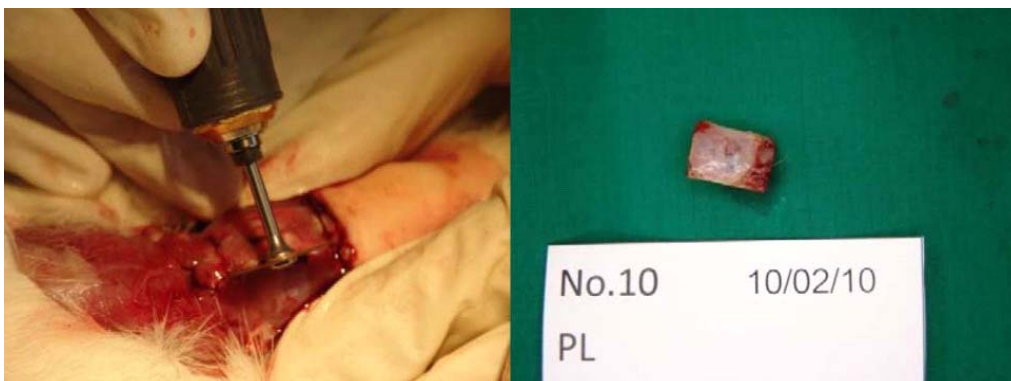
รูปที่ 3. แสดงการเก็บตัวอย่างชิ้นงาน

จากภาพรังสีแสดงให้เห็น ว่ามีการตกผลึกของแคลเซียมทั้งที่กลางรอยแผลและที่ขอบของแผลที่ได้ทำการใส่ชิ้นงานที่ขึ้นรูปจากสารสกัดผิวหนังไว้มังดารงที่ 1 และ ตารางที่ 2 ในขณะที่สารสกัดจากผิวหนังที่ผสมผงกระดูกกลับพบการสะสมของแคลเซียมที่บริเวณกะโหลกศีรษะหนูที่บริเวณขอบแผลเพียง 2 ชิ้นงาน และการสะสมของแคลเซียมที่บริเวณกะโหลกศีรษะหนูที่บริเวณกลางแผลเพียงหนึ่งชิ้นงาน แต่เมื่อเปรียบเทียบความแตกต่างของการเกิดการสะสมของแคลเซียมที่บริเวณกะโหลกศีรษะหนูทั้งที่บริเวณขอบแผล และกลางแผลของกลุ่มสารสกัดจากผิวหนังและกลุ่มสารสกัดจากผิวหนังที่ผสมผงกระดูกพบว่าต่างก็ไม่มีมีความแตกต่างอย่างมีนัยสำคัญที่ระดับความเชื่อมั่น 95% ที่บริเวณขอบแผล ( p = 0.429 ) และที่บริเวณกลางแผล ( p = 0.143 )