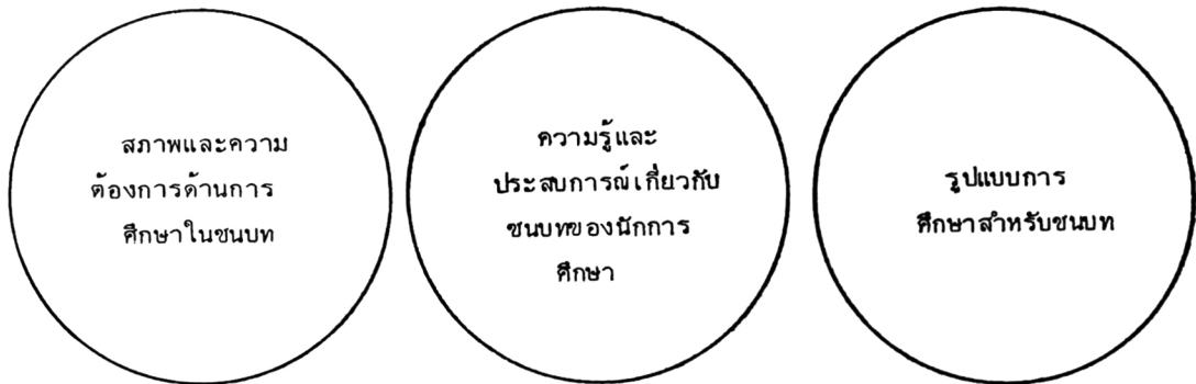
ภาพที่ 1 ความสัมพันธ์ระหว่างสภาพ ความต้องการ ความรู้ และรูปแบบ การศึกษาสำหรับชนบท

ลักษณะที่เป็นอยู่ในปัจจุบัน องค์ประกอบทั้ง 3 ประการ คือ สภาพและความต้องการของชนบท ผู้ที่มีส่วนในการจัดการศึกษานั้นยังไม่ได้นำข้อมูลเกี่ยวกับสภาพความเป็นอยู่และความเป็นอยู่ของประชาชนในชนบทมาใช้ในการกำหนดรูปแบบการศึกษาสำหรับชนบท การศึกษาจึงไม่ค่อยสอดคล้องกับสภาพความเป็นอยู่