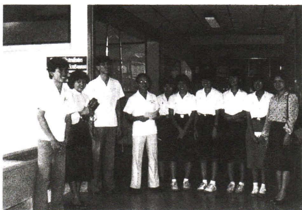
ภาพที่ 1 ทีมงานตรวจเยี่ยมและสำรวจโรงพยาบาลชุมชนที่จะใช้เป็นสถานที่เรียน (ในภาพ รองศาสตราจารย์ นายแพทย์เสรี ร่วมสุข และโรงพยาบาลลำปลายมาศ จ.บุรีรัมย์)