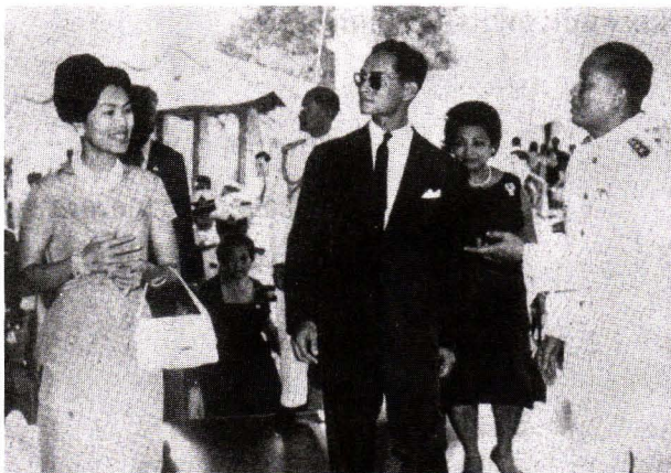
รูปที่ 3. พระบาทสมเด็จพระเจ้าอยู่หัว ฯ และสมเด็จพระนางเจ้าพระบรมราชินีนาถ เสด็จพระราชดำเนินทรงเปิด ดิกลุยส์ ที. เลียว โนเวนส์ 28 พ.ย. 2506