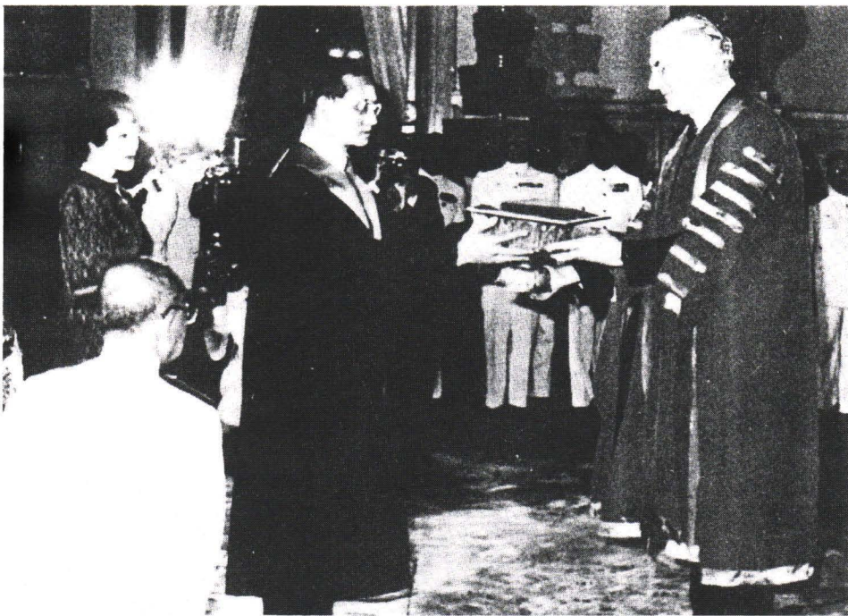
รูปที่ 1. และ 2. ด้วยการประสานสัมพันธ์ไมตรีกับราชวิทยาลัยศัลยแพทย์แห่งประเทศไทย เป็นอย่างดี Sir Geoffrey Slaney ประธานราชวิทยาลัยศัลยแพทย์แห่งประเทศไทย อังกฤษ นำคณะผู้บริหาร ฯ มาทูลเกล้า ฯ ถวายเกียรติบัตรสมาชิกกิตติมศักดิ์ แต่พระบาทสมเด็จพระเจ้าอยู่หัว เมื่อวันที่ 16 ตุลาคม พ.ศ. 2527