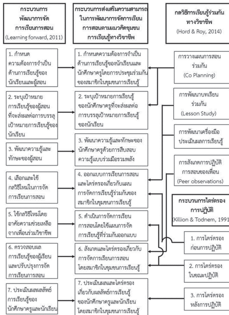
ภาพ 2 การสังเคราะห์กระบวนการส่งเสริมความสามารถในการพัฒนาการจัดการเรียนการสอน ตามแนวคิดชุมชนการเรียนรู้ทางวิชาชีพ

1. สังเคราะห์กระบวนการส่งเสริมความสามารถในการพัฒนาการจัดการเรียนการสอน ตาม แนวคิดชุมชนการเรียนรู้ทางวิชาชีพ ดังแสดงในภาพ 2