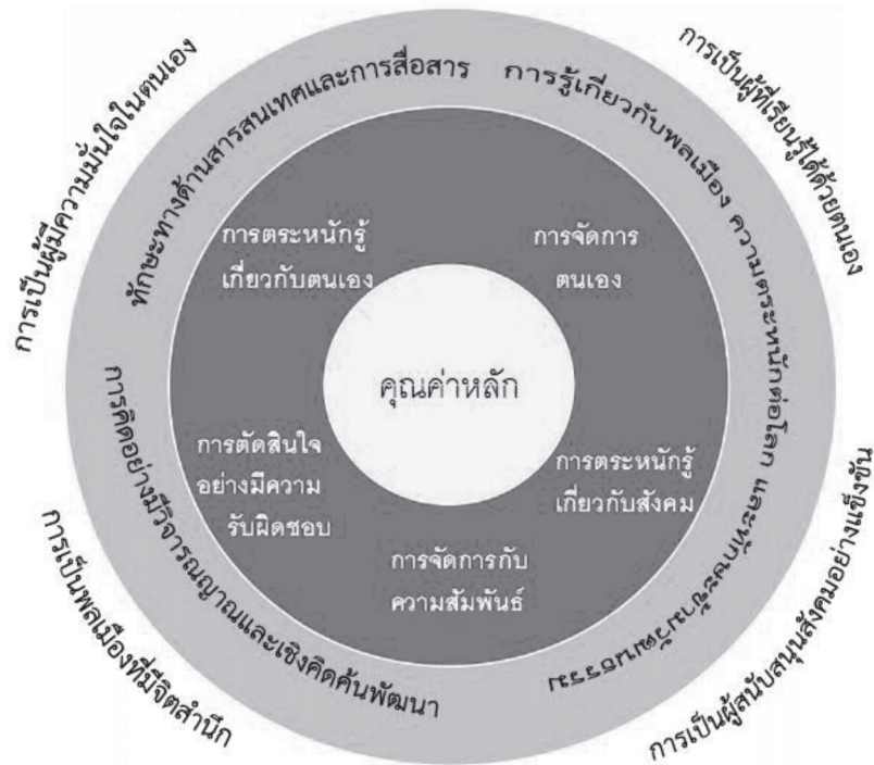
ภาพที่ ๒ กรอบแนวคิด สมรรถนะและผลลัพธ์ของนักเรียนในศตวรรษที่ ๒๑ ของประเทศสิงคโปร์

๑. คุณค่าหลัก (Core Values) ชั้นในสุดของกรอบแนวคิด คือ “คุณค่าหลัก” ซึ่งเป็นแก่นของสมรรถนะและผลลัพธ์ของนักเรียนในศตวรรษที่ ๒๑ ที่แสดงคุณลักษณะภายในของแต่ละบุคคล (a person’s character) โดยประกอบด้วยความรู้และทักษะเป็นแกนหลัก และมีคุณลักษณะสำคัญที่มีอิทธิพลทำให้เกิดความเชื่อ ทักษะคิด รวมถึงพฤติกรรมของบุคคล ดังนี้