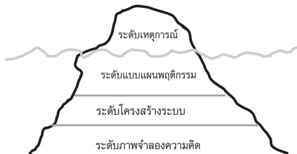
ภาพ 2 ระดับการคิด ของวิธีคิดของการคิดเชิงระบบ

1. การคิดเชิงระบบเป็นอีกรูปแบบหนึ่งของวิธีคิดของมนุษย์ที่ใช้ในการมองปัญหาให้ลึกลงไปกว่าเหตุการณ์ที่เกิดขึ้น โดยการคิดเชิงระบบจะเป็นการมองให้เห็นถึงแบบแผนหรือรูปแบบพฤติกรรมที่เกิดขึ้น ทำให้เห็นรากเหง้าของปัญหาและปัจจัยต่าง ๆ ที่เกี่ยวข้องกับปัญหานั้น ๆ ซึ่งจะทำให้บุคคลเกิดความเข้าใจในปัญหาของระบบนั้นอย่างลึกซึ้งมากขึ้น และจะนำไปสู่การแก้ปัญหาที่รากเหง้าของปัญหาอย่างแท้จริง หากเปรียบเทียบการคิดเชิงระบบกับภูเขาน้ำแข็งที่โผล่เหนือน้ำ จะสามารถวิเคราะห์วิธีคิดเชิงระบบ ได้ 4 ระดับ ดังแสดงในภาพที่ 2 (สถาบันพัฒนาและรับรองคุณภาพโรงพยาบาล, 2548; มกรรพันธุ์ จูฑะรสก, 2551; แอนเดอร์สัน และจอนด์สัน, 2550)