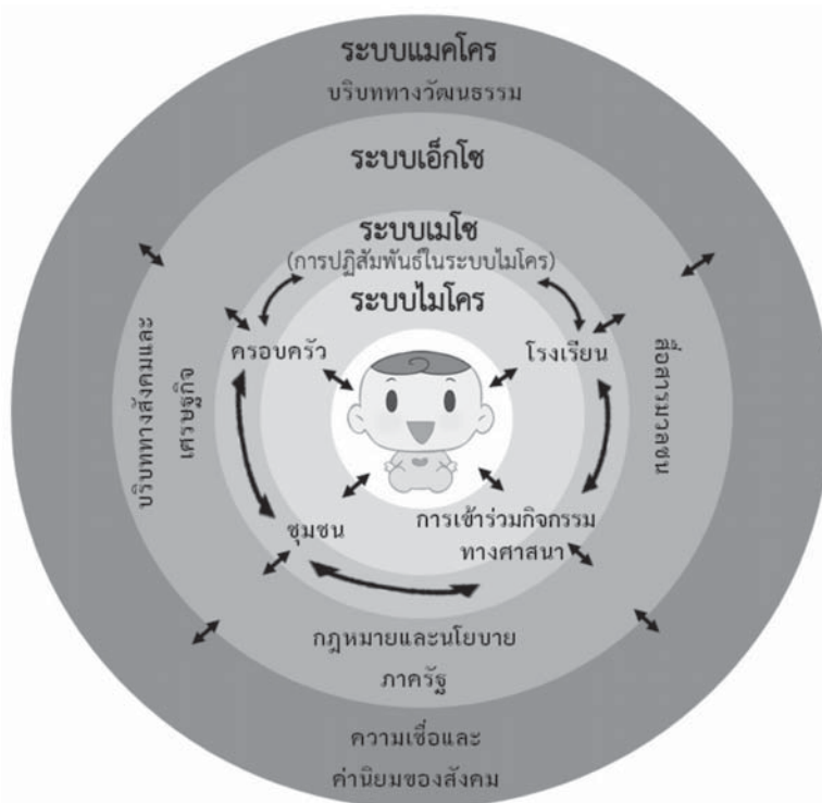
แผนภาพ 1 ปรับจากโมเดลเชิงชีวนิเวศวิทยา (Bioecological Model) ของ Bronfenbrenner and Morris (Bredekamp, 2014)

ความสามารถของเด็กในการปรับตัวกับการเปลี่ยนแปลงในระยะรอยเชื่อมต่อระหว่างชั้นเรียนอนุบาลและชั้นประถมศึกษาที่ได้รับอิทธิพลจากการปฏิสัมพันธ์ระหว่างเด็กกับบริบทที่อยู่รอบตัวสามารถอธิบายโดยใช้แนวคิดของโมเดลเชิงชีวนิเวศวิทยาได้ดังนี้ การที่เด็กอนุบาลสามารถปรับตัวกับการเปลี่ยนแปลงและก้าวผ่านช่วงรอยต่อระหว่างชั้นเรียนอนุบาลและชั้นประถมศึกษาไปได้อย่างราบรื่นนั้นเริ่มต้นจากการที่พ่อแม่ ครู และชุมชนมีปฏิสัมพันธ์ที่ดีกับเด็ก ได้แก่ การที่พ่อแม่ส่งเสริมความพร้อมทางการเรียนของเด็กอย่างเหมาะสมกับวัยและเข้าใจธรรมชาติของเด็ก โดยให้การส่งเสริมเด็กให้มีทักษะในการช่วยเหลือตนเอง เปิดโอกาสให้เด็กได้ปฏิสัมพันธ์กับผู้อื่น รวมถึงวิธีการจัดการเรียนรู้ของครูอนุบาลที่มุ่งเน้นการพัฒนาเด็กอย่างสมดุลรอบด้านทั้งด้านร่างกาย สังคม อารมณ์จิตใจ และสติปัญญา เมื่อเข้าเรียนชั้นประถมศึกษาปีที่ 1 ครูประถมศึกษามีความคาดหวังต่อความพร้อมทางการเรียนของเด็กในการเข้าเรียนชั้นประถมศึกษาปีที่ 1 อย่างเหมาะสม มีการปฏิสัมพันธ์ที่ดีและสร้างความไว้วางใจให้กับเด็ก จัดการเรียนรู้โดยคำนึงถึงพัฒนาการและการเรียนรู้ของเด็กวัย 5-6 ปี จัดตารางกิจกรรมประจำวัน สภาพแวดล้อมในห้องเรียนที่มีความใกล้เคียงกับชั้นอนุบาลจะช่วยส่งผลให้เด็กมีทักษะคุณลักษณะ และความรู้พื้นฐานที่จำเป็นต่อการเรียนรู้ในชั้นประถมศึกษาปีที่ 1 และมีความพร้อมในการรับมือกับเปลี่ยนแปลงเมื่อเข้าเรียนในชั้นประถมศึกษาปีที่ 1 ได้เป็นอย่างดี ซึ่งเป็นการปฏิสัมพันธ์ในระบบไมโคร การมีปฏิสัมพันธ์ซึ่งกันและกันระหว่างบุคคลที่อยู่รอบตัวเด็ก ได้แก่ การติดต่อกันระหว่างพ่อแม่