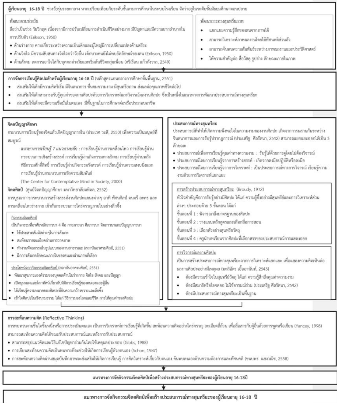
แผนภาพ 1 กรอบแนวคิดการวิจัย