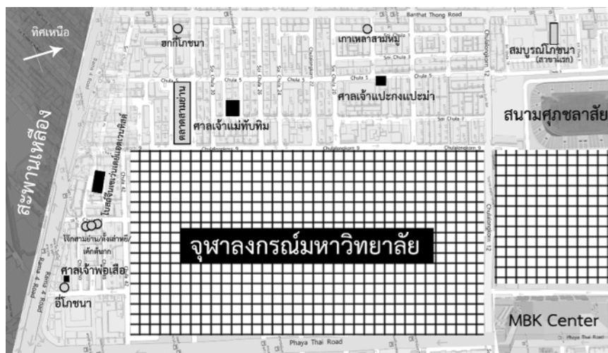
ภาพที่ 1 แผนที่แหล่งเรียนรู้ชุมชนสามย่าน

ในประเทศจีน นอกจากนั้นในศตวรรษที่ยังมีการเรียกรังว่าจางช่างจีนโพ้นทะเลให้เข้ามา สร้างศาสนวัตถุต่าง ๆ อย่างวิจิตรบรรจง ศิลปกรรมที่ถูกสร้างขึ้นด้วยความตั้งใจอย่าง ฐานะความเป็นศูนย์กลางชุมชน ทั้งศาลเจ้าพ่อเสือและศาลเจ้าแม่ทับทิมยังปรากฏวัตถุที่เป็น ร่องรอยว่าทั้งสองศาลเคยมีพิธีแห่เทวรูปและม้าทรงมาก่อน