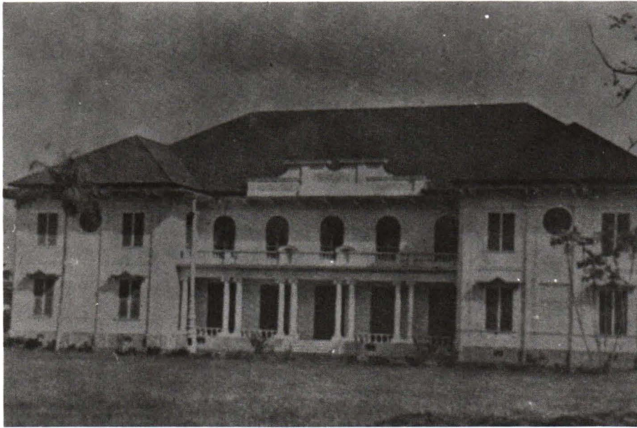
ภาพที่ 2. ดิกรักรพงษ์ ยังคงสวยงาม แม้ทางด้านหน้าจะถูกบังไปบางส่วน