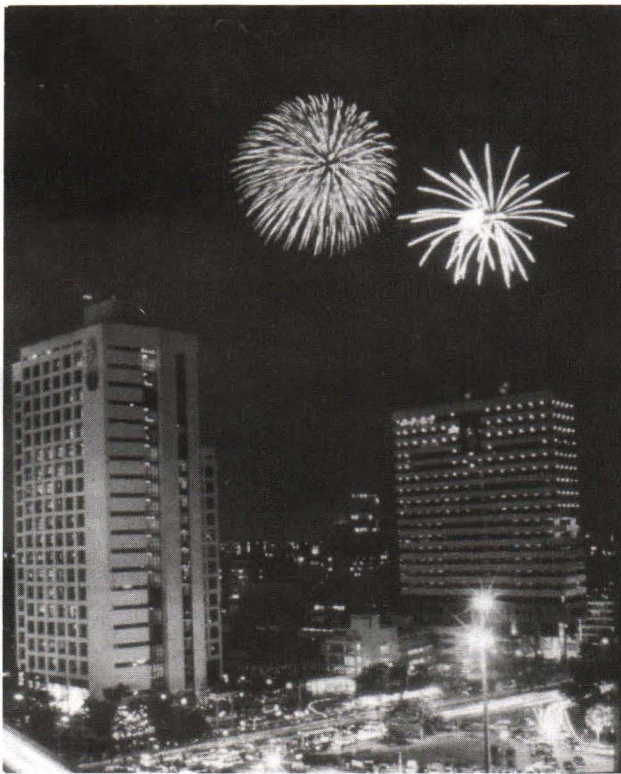
ภาพที่ 3. ดิกรักร. เคียงคู่ด้วยดิกร. สก. ภูมิทัศน์และ สถาปัตยกรรมอัจฉริยะสมัยใหม่