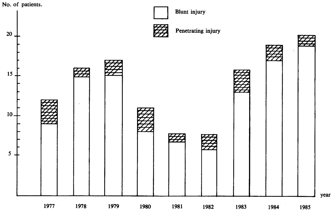
Diagram 1 Incidence of child injury.

พบว่าในปี 2528 ซึ่งเป็นปีสุดท้ายที่ทำการศึกษามีผู้ป่วยมากที่สุด 20 ราย ส่วนในแต่ละปีก็พบว่าผู้ป่วยมีแนวโน้มลดลงในช่วงระยะปี 2523-2525 แล้วค่อย ๆ เพิ่มขึ้น ผู้ป่วยในทุกปีนั้นพบว่าได้รับภยันตรายชนิด Blunt มากกว่าแบบที่เกิดจากของมีคมแทงทะลุ รายละเอียดแสดงในแผนภูมิที่ 1