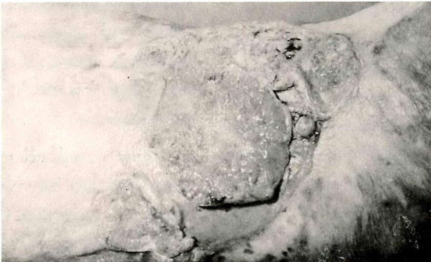
รูปที่ 2 แผลมะเร็งชนิดเนื้องอกนูน (Cauliflower Type) ทั้ง 2 แบบมักมีการเปลี่ยนแปลงจากขอบของแผลเข้าหาจุดกลาง