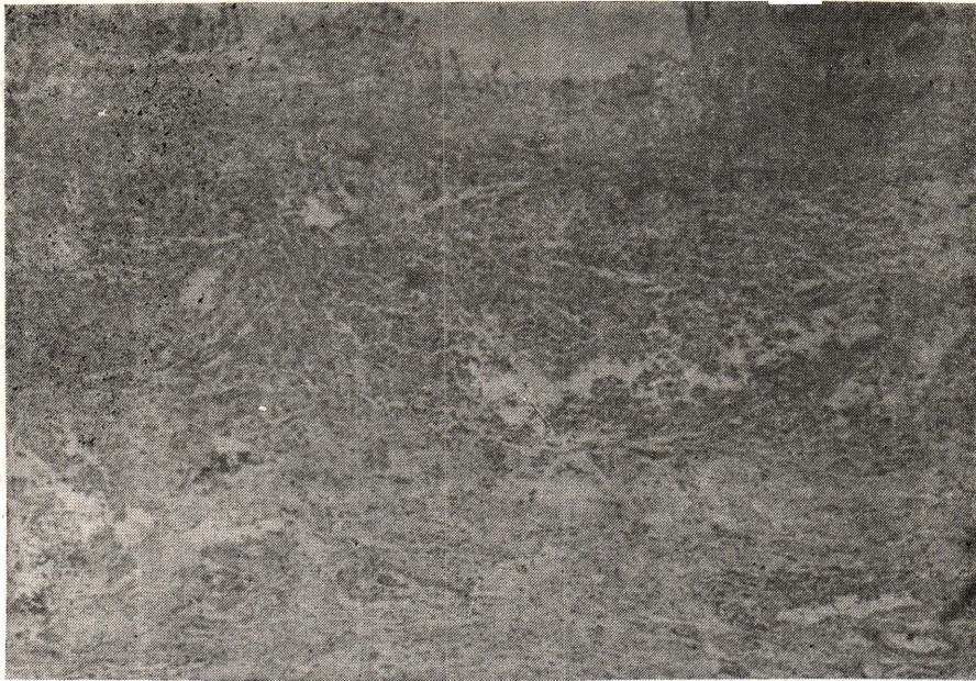
รูปที่ 3 ลำไส้ใหญ่ แสดงผลในชั้น Mucosa + Submucosa เซลล์อักเสบ ส่วนใหญ่เป็นชนิด Mononuclear H&E \times 40