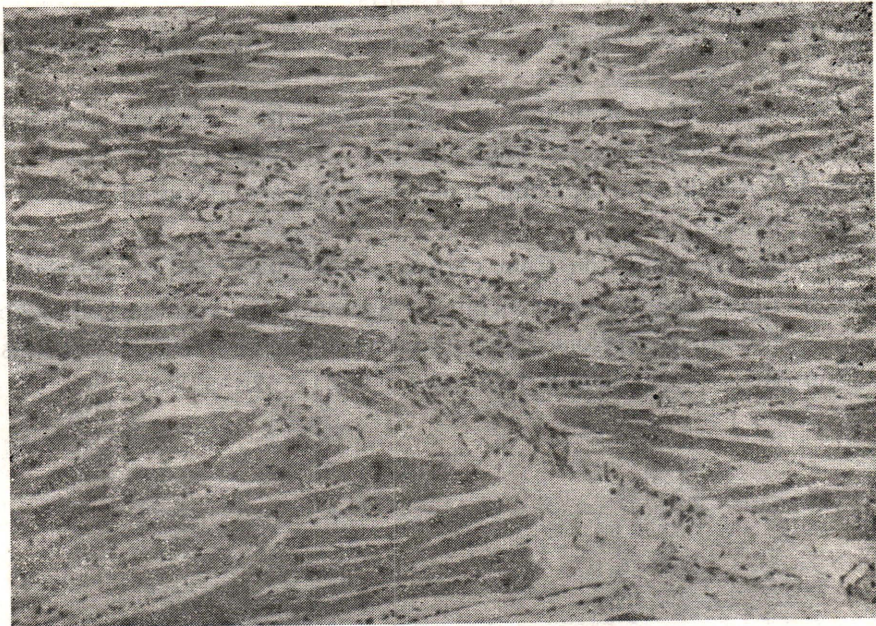
รูปที่ 4 กล้ามเนื้อหัวใจ แสดงการอักเสบเป็นหย่อมๆ เซลล์อักเสบที่พบเป็นชนิด Mononuclear H&E \times 100