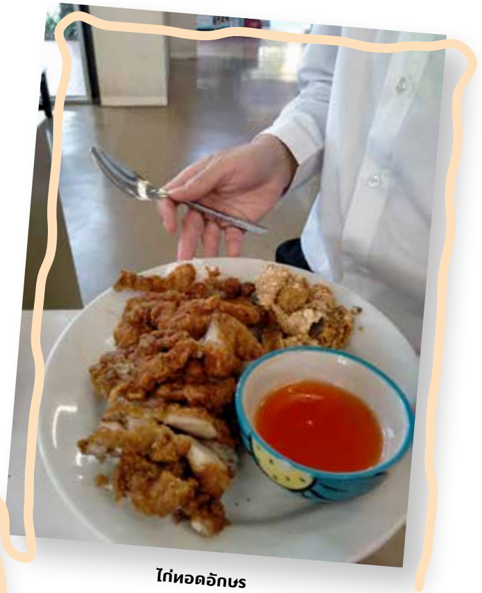
ไก่ทอดอักษร

เริ่มต้นที่ฝั่งหอประชุมฯ เมนู ไก่ทอดอักษร เป็นดาวเด่นของเมนูอาหารในรั้วจุฬาฯ ที่มีชื่อเสียงมา ยาวนาน เป็นต้นตำรับไก่ทอดร้อนๆ คู่กับข้าวเหนียวและ น้ำจิ้มที่เป็นที่รู้จักกันไปทั่วจุฬาฯ (จนถึงกับต้องขยายอีก สาขาไปที่โรงอาหารคณะวิศวกรรมศาสตร์) ในร้านเดียวกันนี้ มีอาหารอีสานอร่อยๆ เช่น ลาบแซลมอน ต้มแซ่บ คอหมูย่าง ในราคาเพียงจานละ 30 บาทเท่านั้น