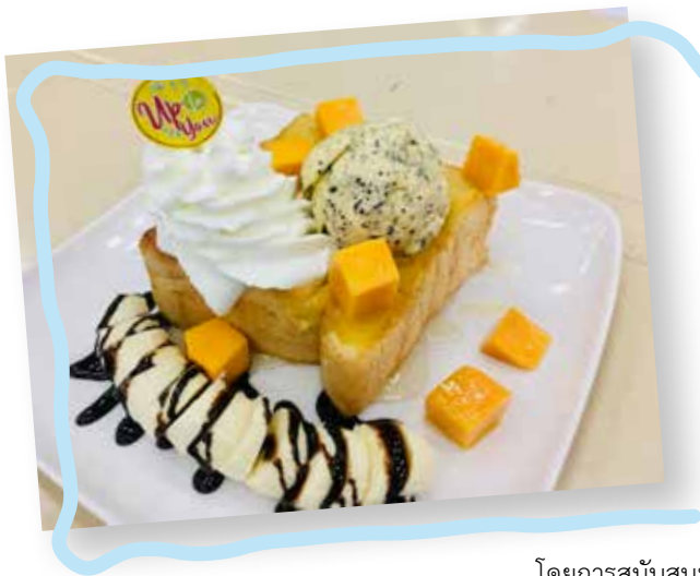
ปังเย็นครุศาสตร์

หรือหากใครที่ชอบบรรยากาศใหม่ แบบแอร์เย็นฉ่ำ ก็ต้องไปรับประทานที่ ศูนย์อาหาร Food World ร้านอาหารน้องใหม่ล่าสุด ซึ่งสร้างขึ้นพร้อมกับอาคารใหม่ของคณะทันตแพทยศาสตร์ ระดับราคาเฉลี่ยจะสูงกว่าร้านอาหารอื่นๆ เล็กน้อยที่ 40-60 บาทต่อจาน แต่ความอร่อยก็คุ้มราคาที่จ่ายไม่แพ้ที่อื่นเลย