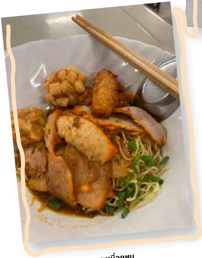
บะหมี่ทอดหน

โรงอาหารคณะอักษรศาสตร์ ที่ตั้งอยู่ข้างอาคาร มหาจักรีสิรินธรนี้มีที่นั่งรับประทานถึงสองชั้น ทั้งแบบ เปิดโล่งและแบบปรับอากาศ นอกจากข้าวเหนียวไก่ทอด ที่ขึ้นชื่อแล้ว ยังมีอาหารอร่อยร้านอื่นให้เลือก เช่น ข้าวซอย ก๋วยเตี๋ยวไก่ และกวยช่ายทอด กับไส้อั่ว อีกด้วย