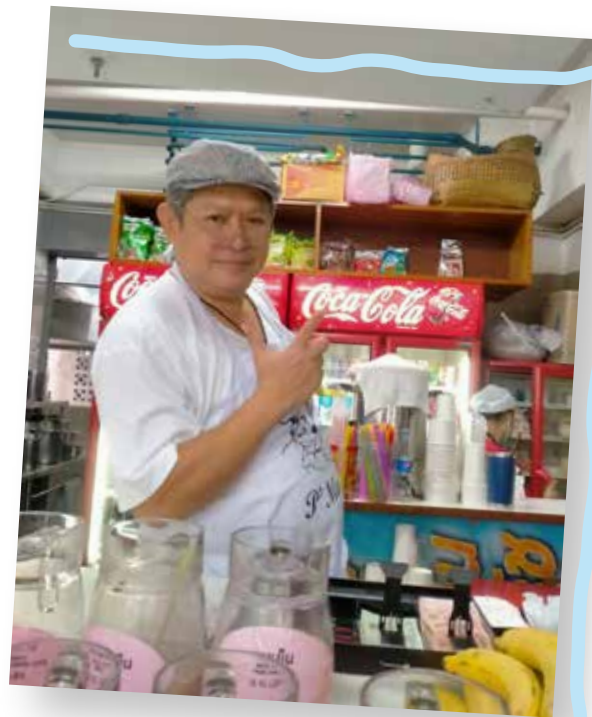
ร้านพีแมน

นอกจากปังเย็นแล้ว ร้านอาหารครุศาสตร์ ยังมี ร้านเครปญี่ปุ่น ที่มีทั้งเครปแบบเครื่องทะเลลึกและทาโกยากิ ร้อนๆ กับ ร้านเจาก๊วยฮ่องกง เด่นในเมนูเจาก๊วยนมสด น้ำโกโก้ ชาเขียว และชานม แต่ถ้าจะลองปังเย็นอีกแบบที่ต่างไป ก็สามารรถข้ามไปฝั่งมานูญครอง ที่ ร้านปังเย็นร้านอาหารคณะสหเวชศาสตร์ ก็อร่อยและนิยมในหมู่นิสิตไม่แพ้กัน