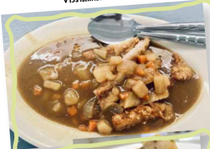
ข้าวราดแกงกะหรี่ปุ้นคัตลี

เมื่อข้ามมาฝั่งสามย่าน โรงพยาบาลในจุฬาฯ ก็ยังสร้างความตื่นตาตื่นใจให้นิสิตและนักชิม เพราะที่โรงพยาบาลนิเทศศาสตร์-นิติศาสตร์ ที่อาคารพินิตประชานาถ มีร้าน Bbee ที่จำหน่ายเมนูข้าวไข่ข้นสุดครีเอทต่างๆ ไม่ว่าจะเป็นข้าวไข่ข้นคาโบนาร่า ข้าวไข่ข้นต้มยำกุ้ง ข้าวไข่ข้นซอสมันกุ้ง แล้วยังมีเมนูอาหารคลีนจำหน่ายเอาใจคนรักสุขภาพอีกด้วย