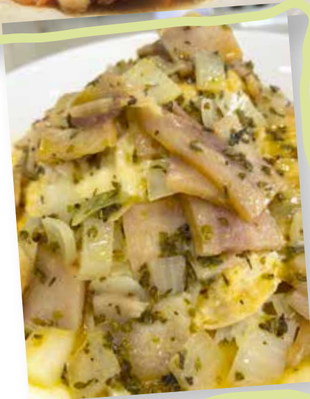
ข้าวไข่ข้นคาโบนาร่า