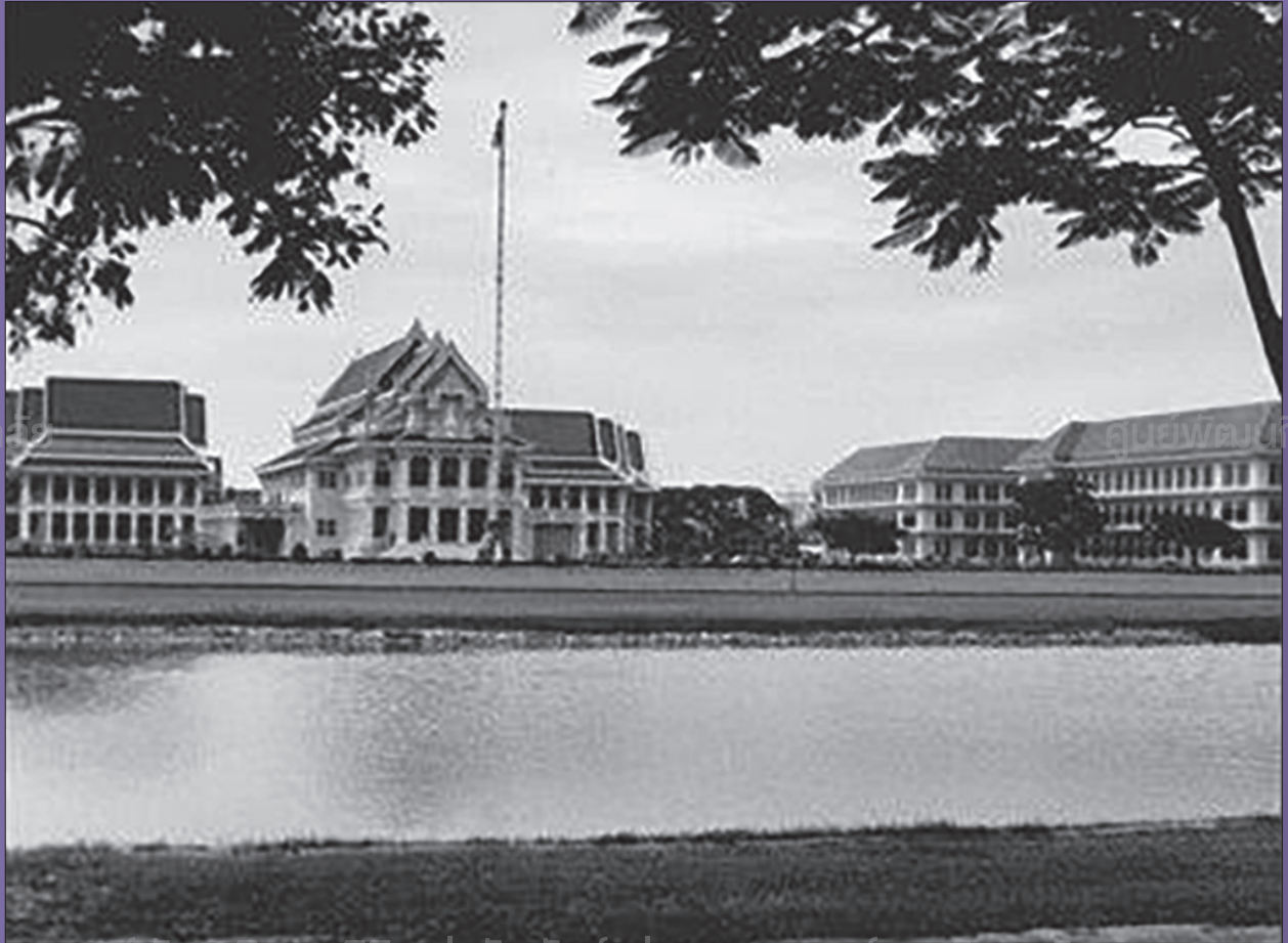
ศูนย์พัฒนาธุรกิจและนิสิตเก่าสัมพันธ์แห่งจุฬาลงกรณ์มหาวิทยาลัย