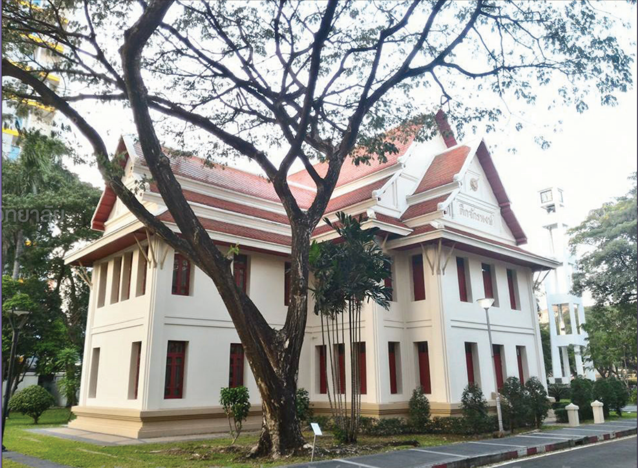
ศูนย์พัฒนกิจและนิสิตเก่าสัมพันธ์แห่งจุฬาลงกรณ์มหาวิทยาลัย

สมัยโน้นไม่มี Shuttle Bus อย่างตอนนี้ นิสิตรุ่นนั้นจึงต้องพึ่ง ‘ขา’ ตัวเองก่อนที่จะมีรถขับ พวกเราเดินสำรวจชีวิตในจุฬาทุกวัน ได้เห็นทีมนักกีฬาของมหา’ลัยซ้อมที่สระว่ายน้ำ ได้เห็นรุ่นพี่ที่ทำกิจกรรมส่วนกลางเดินเข้าออกตึกจักรพงษ์ตลอดเวลา ได้เห็นทีมฟันดาบซ้อมอย่างขันแข็งข้างตึก ๑ พอใกล้สอบเราจะเดินทางไกลไปหอสมุดกลางฝั่งโน้นเพื่อไปยืมหนังสือมาอ่าน ทุกวันพวกเราต้องหาเรื่องเดินไปซื้อของที่สหกรณ์จุฬาใต้ศาลาพระแก้ววันละหลายรอบ เปื้อๆ ก็เดินไปหาของกินและน้ำบ่นที่คณะบัญชีที่ๆ ที่ร้านที่ล้วนในโรงอาหารคณะก็มีเหมือนกัน พอโตเป็นพี่ปี ๔ พวกเราก็พัฒนาไปนั่ง ‘ร้านเอก’ นอกรั้วบัญชี กินส้มตำแอบจิบสพายไวน์คูเลอร์ที่เพิ่งเปิดตัวแล้วเดินแก้มแดงกลับคณะ นานๆ ครั้งถึงจะเดินไปโรงอาหารอักษรเพื่อซื้อลูกชิ้นปิ้งเพราะต้องทำใจกล้าหน้าเข็ดเวลาโดนแซวตรงสามแยกปากหมา ยุคนั้นสาวๆ ที่เป็น ‘คนจริง’ ต้องกล้าไปนั่งกินข้าวกลางวันในโรงอาหารวิเศษ และเมื่อไหร่ก็ตามที่ต้องทำกิจกรรมและหาซื้อของอย่างเร่งด่วน พวกเราจะเดินข้ามไปฝั่งสามย่าน ที่พึ่งของนิสิตทุกคนคือ ‘ร้านจี๋อ้อย’ ร้านสารพัดนึกที่มีตั้งแต่สากระเบือยันเรือรบ การเดินไปเดินมาของพวกเราทำให้เก็บรายละเอียดของอดีตได้หลายจุดจนเมื่อดิฉันเดินตามเส้นทางเดิมอีกครั้งก็ไม่พบหลายสิ่งทีครั้งหนึ่งเคยมีอยู่