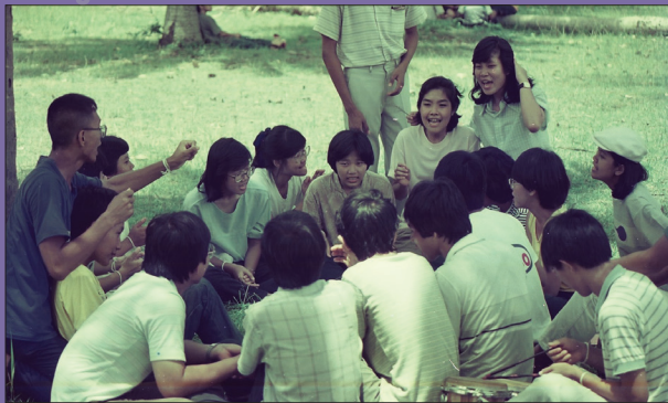
น้องใหม่สัมพันธ์ ๑๕-๑๗ มิ.ย. ๒๕๒๗