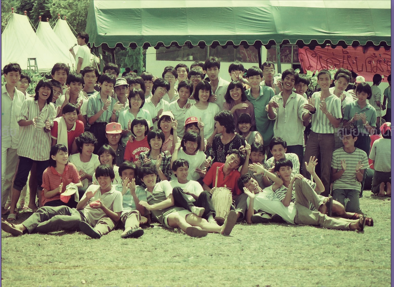
น้องใหม่สัมพันธ์ ๑๕-๑๗ มิ.ย. ๒๕๒๗ - นิสิตเก่าสัมพันธ์แห่งจุฬาลงกรณ์มหาวิทยาลัย