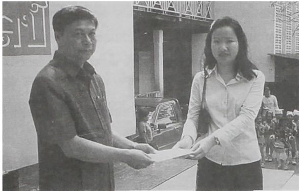
รูปที่ 10 ผู้อำนวยการโรงเรียนธัญญสิทธิศิลป์มอบเงินจากตัวแทนสถาบันวิจัยสภาวะแวดล้อมจุฬาฯ เพื่อสมทบทุนโครงการธนาคารความดี

ทางโรงเรียนได้รับการสนับสนุนจากองค์กรในท้องถิ่น ได้แก่ เทศบาลตำบลรังสิต องค์การบริหารส่วนตำบล องค์การบริหารส่วนจังหวัด ช่วยสนับสนุนในเรื่องเงิน เช่น ทุนการศึกษา ชุดกีฬา เป็นจำนวนมากเพื่อตอบแทนในการทำความดีของเด็ก รวมทั้งผู้ปกครองมีส่วนช่วยอย่างมากในการสนับสนุนโครงการธนาคารความดี และที่สำคัญต้องขอขอบคุณ สถาบันวิจัยสภาวะแวดล้อม จุฬาฯ ที่ได้ช่วยเหลือโครงการธนาคารความดีด้วยดีตลอดมา