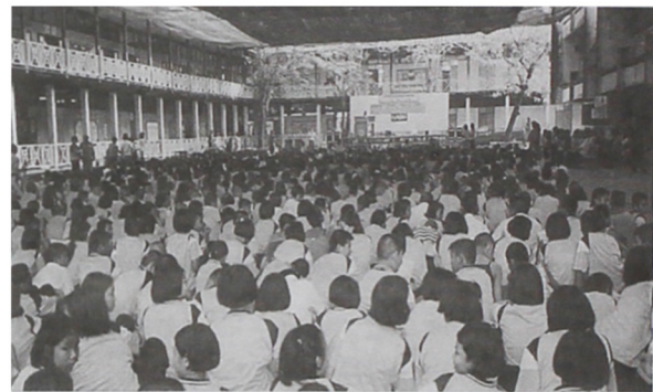
รูปที่ 9 เด็กนักเรียนเข้าร่วมกิจกรรมวันธนาคารความดี โดยแต่ละคนจะนำบัตรเครดิตคะแนนความดีมาแลกขนมและของใช้ต่าง ๆ

ดำเนินโครงการธนาคารความดีเกี่ยวกับการจัดการขยะมาก็ีไปแล้วและคิดว่ามีความก้าวหน้ามากขึ้นแล้ว