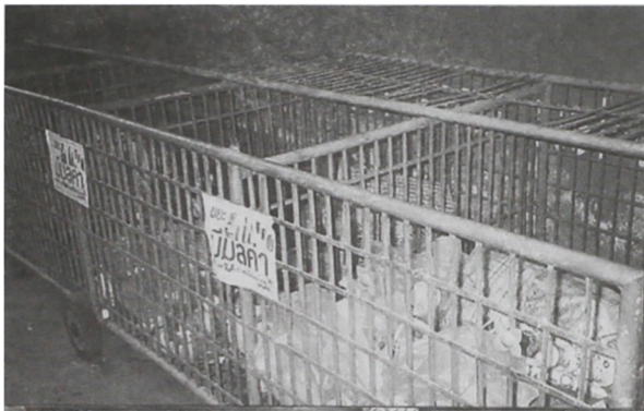
รูปที่ 7 เมื่อเด็กนำขยะมาจากที่บ้านจะนำมาคัดแยกเพื่อจะได้นำไปขายให้กับพ่อค้าต่อไป

ส่วนการจัดการขยะที่แยกไว้นั้น เมื่อมีจำนวนมากทางโรงเรียนจะติดต่อไปยังคนรับซื้อขยะมีมูลค่าบ้างก็ซื้อขาย แต่ละปีโรงเรียนได้เงินจากการขายขยะมีมูลค่า ซึ่งของเหล่านี้เมื่ออยู่ที่บ้านจะมีค่าน้อยมากหรือไม่มีความเลยเพราะจะทำให้สิ่งแวดล้อมที่บ้านไม่ดีด้วย แต่เมื่อของเล็ก ๆ น้อย ๆ เหล่านี้ถูกเก็บมารวมอยู่ที่โรงเรียนจะกลายเป็นของที่ มีราคา สำหรับปีนี้เราขายขยะมีมูลค่าได้เป็นเงิน 2,168 บาท แล้วนำเงินจำนวนนี้ไปใช้ซื้อของในงานวันธนาคารความดี เช่น กางเกงแฟนซี 2 โหล ผ้าขนหนูผืนเล็ก 2 โหล ผ้าเช็ดตัวผืนใหญ่ 1 โหล และกางเกงในตัวเล็กสำหรับเด็กอนุบาล เพราะบางครั้งเด็กมาถึงโรงเรียนแล้วเกิดภาวะจำเป็นบางอย่างต้องใช้ จึงจำเป็นต้องซื้อเอาไว้ ซึ่งเด็กจะแลกเปลี่ยนเอาไว้ใช้ แต่บางคนจะแลกเปลี่ยนเอาไว้ใช้ที่บ้าน