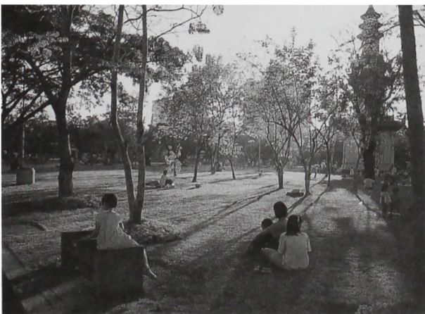
สิ่งแวดล้อมที่ได้นำมาซึ่งคุณภาพชีวิตที่ดี