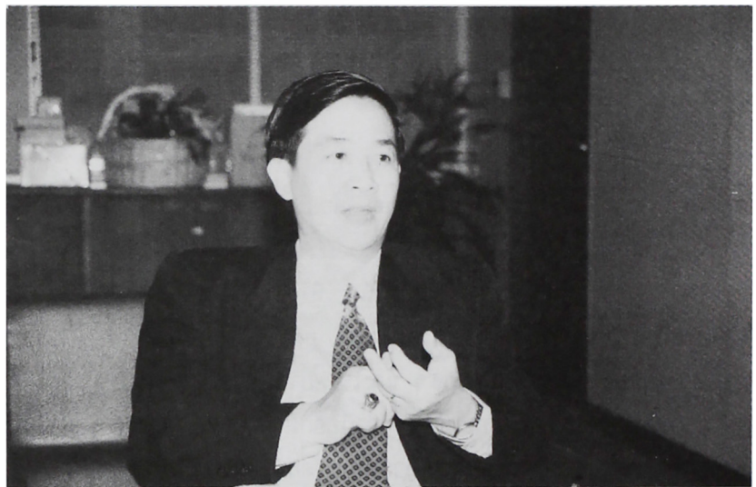
ดร.ศักดิ์สิทธิ์ ตรีเดช เลขาธิการสำนักงานนโยบายและแผนสิ่งแวดล้อม

นับตั้งแต่ประกาศใช้พระราชบัญญัติส่งเสริมและรักษาคุณภาพสิ่งแวดล้อม พ.ศ. 2535 เป็นต้นมา ประเทศไทยมีสำนักงานนโยบายและแผนสิ่งแวดล้อมหรือที่เรียกกันสั้น ๆ ว่า “สม.” เป็นหน่วยงานที่ทำหน้าที่ดูแลนโยบายด้านการจัดการและการใช้ทรัพยากรธรรมชาติ และหากติดตามข่าวสารด้านสิ่งแวดล้อมเป็นประจำ ชื่อ “สม.” คงเป็นชื่อที่คุ้นหูคุ้นตาเป็นฐานะหน่วยงานที่ทำหน้าที่ของตนอย่างเข้มแข็งจริงจังเมื่อไม่นานนี้ สม. เพิ่งจะมีเลขาธิการคนใหม่ พร้อมทั้งเป็นโอกาสที่เราเพิ่งเริ่มต้นพ.ศ.ใหม่ ทิศทางการทำงานด้านสิ่งแวดล้อมของหน่วยงานสำคัญแห่งนี้ ซึ่งอาจจะสามารถสะท้อนถึงอนาคตส่วนหนึ่งของสิ่งแวดล้อมไทย จึงเป็นเรื่องที่วารสารสิ่งแวดล้อมสนใจและติดตามมานำเสนอต่อท่านผู้อ่าน