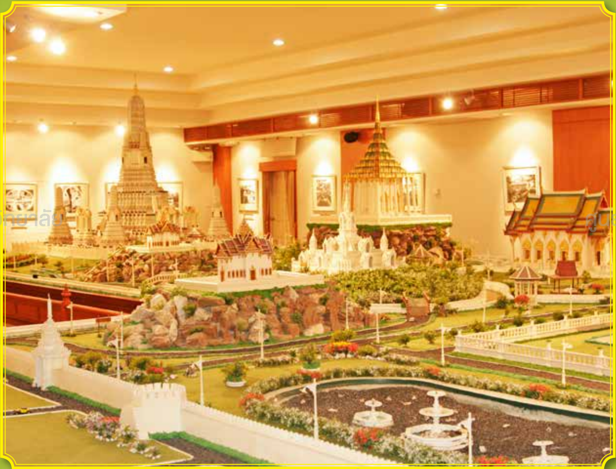
ศูนย์พัฒนกิจและนิสิตเก่าสัมพันธ์แห่งจุฬาลงกรณ์มหาวิทยาลัย

กระทรวงมหาดไทย ทั้งพระองค์ทรงเป็นทวยนาครคนหนึ่ง ทรงพระนามว่า “นายราม ฌ กรุงเทพ” มีอาชีพทนายความ และเป็นผู้นำพรรคแพรรแถบสีน้ำเงิน โดยมีพรรคแพรรแถบสีแดงเป็นคู่แข่งชั้น