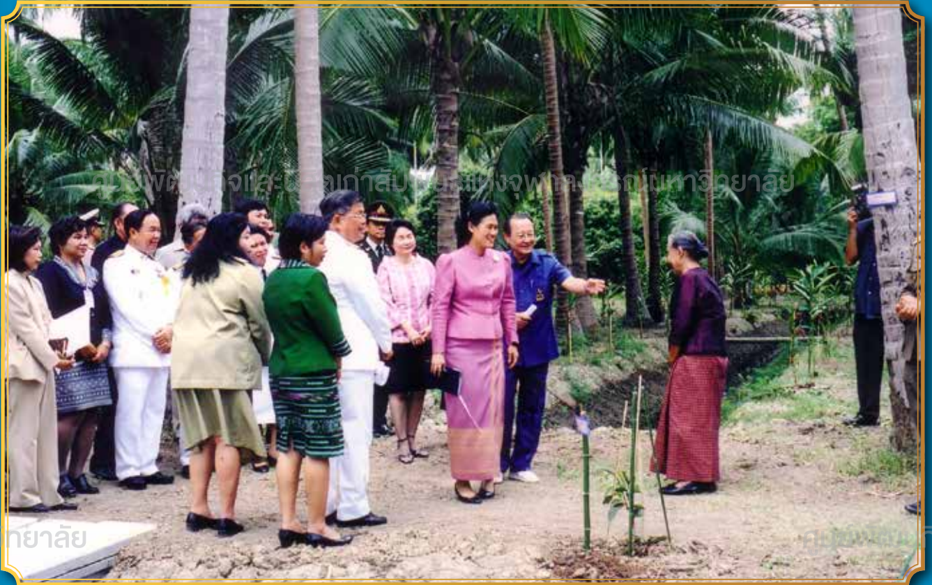
สมเด็จพระเทพรัตนราชสุดาฯ สยามบรมราชกุมารี ได้เสด็จพระราชดำเนินเยี่ยมพื้นที่ของมูลนิธิชัยพัฒนาใน พ.ศ. ๒๕๔๘

อัมพวาเป็นแหล่งท่องเที่ยวอดนียมแห่งหนึ่งของประเทศที่เกิดจากการอนุรักษ์และฟื้นฟูชุมชน เบื้องหลังของความสำเร็จนี้เกิดจากพระราชดำริของสมเด็จพระเทพรัตนราชสุดาฯ สยามบรมราชกุมารี ที่ทรงให้การสนับสนุน