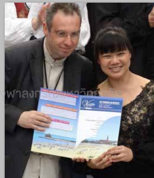
รับใบประกาศรางวัล