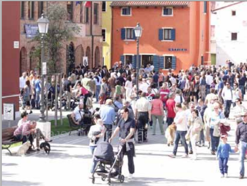
ร้องเพลงโซ่สนุกๆระหว่างรอบประกวด

รับประทานอาหารเช้าที่โรงแรมเดินทางไปยัง Centro civico เพื่อฝึกซ้อมระหว่าง ๑๑:๐๐-๑๒:๓๐ รับ