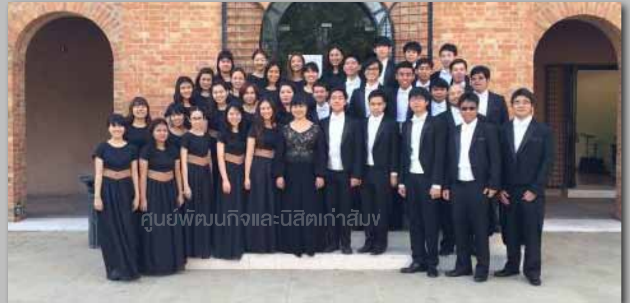
คณะนักร้องประสานเสียงจุฬาลงกรณ์มหาวิทยาลัย (Chulalongkorn University Concert Choir)

หลังจากการประกวด นักร้องกลับโรงแรม เปลี่ยนเครื่องแต่งกายรับประทานอาหารเช้าตามอัธยาศัย