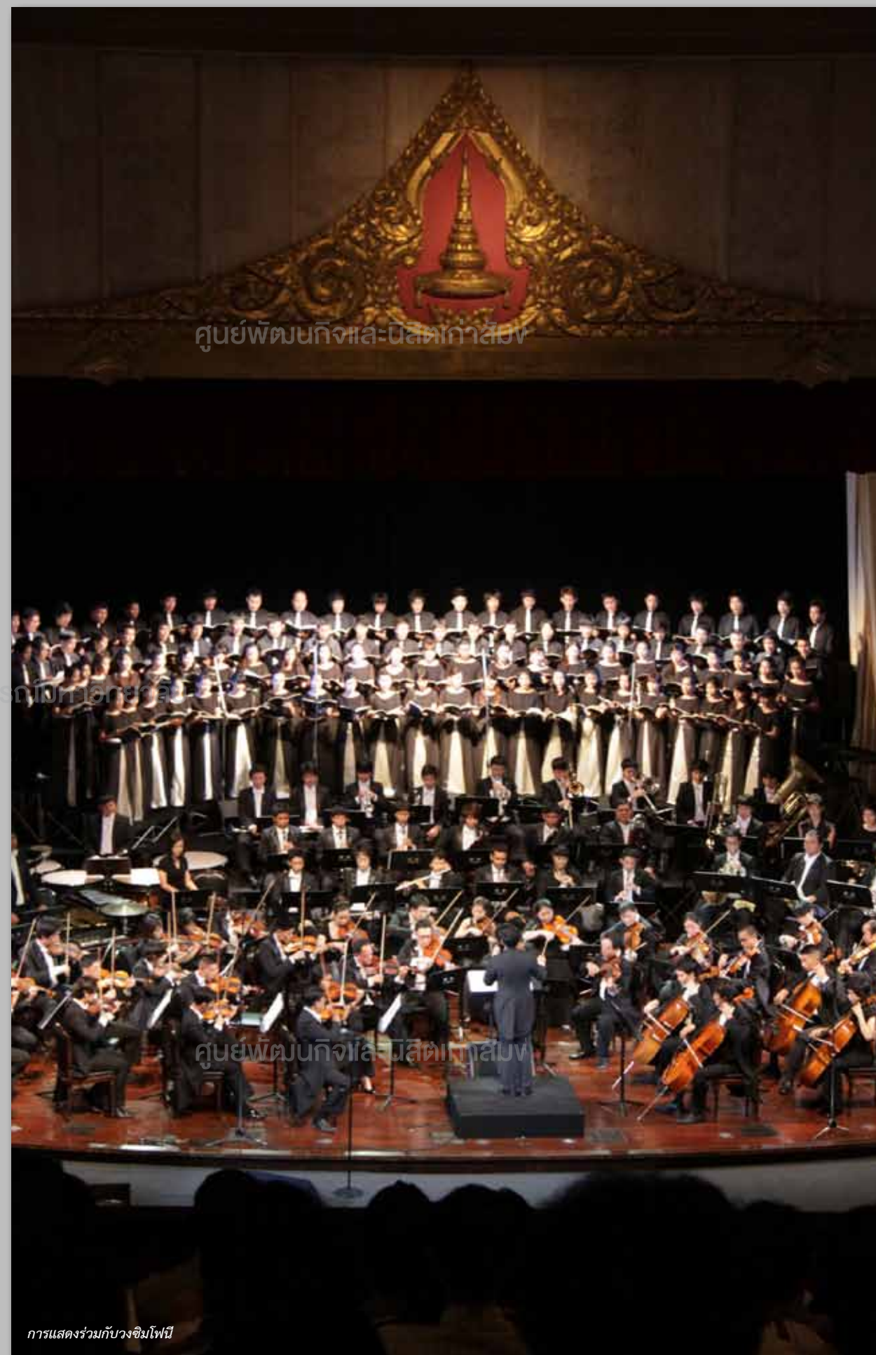
การแสดงร่วมกับวงซิมโฟนี

อีกวงหนึ่งคือ คณะนักร้องประสานเสียงจุฬาลงกรณ์มหาวิทยาลัย (Chulalongkorn University Concert Choir) ได้ผ่านการคัดเลือกและ