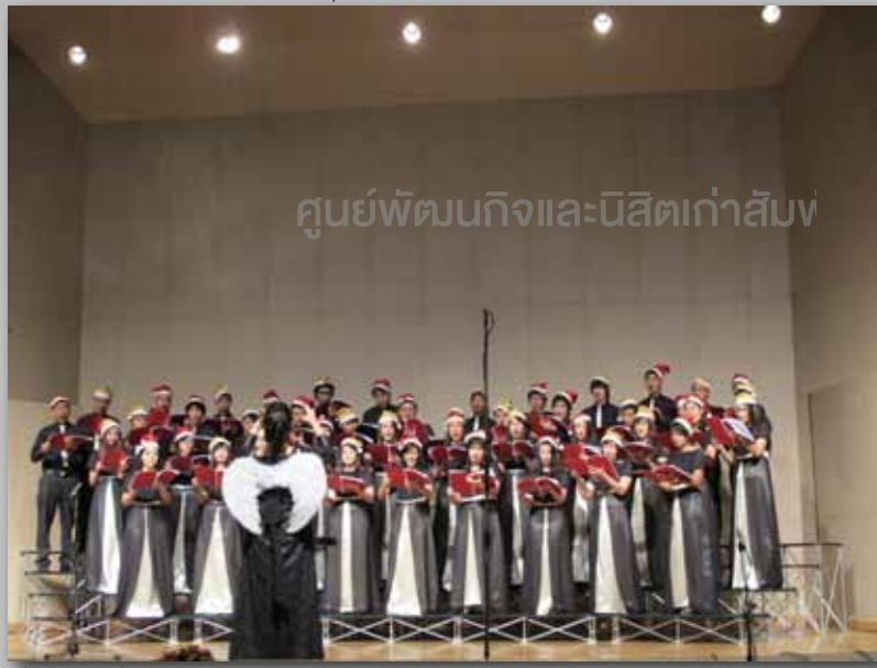
ที่หอแสดงดนตรีจุฬา

ดนตรีขับร้องประสานเสียงมาโดยตลอด สมาชิกของวงนอกจากจะเป็นนิสิตจุฬาลงกรณ์มหาวิทยาลัยเป็นหลักแล้ว ก็มีผู้ที่มาชมคอนเสิร์ตหรือเป็นเพื่อนๆ ของนิสิตที่เป็นสมาชิกอยู่แล้วที่มีความประทับใจในการแสดงของวงฯ และมีความเชื่อมั่นว่าวงฯ สามารถให้ความรู้และประสบการณ์ที่ดีในการขับร้องประสานเสียงได้ โดยปัจจุบัน มีสมาชิกจำนวน ๔๐ คน เป็นนิสิตปัจจุบันจุฬาลงกรณ์มหาวิทยาลัยจำนวน ๒๖ คน บัณฑิตจุฬาลงกรณ์มหาวิทยาลัย ๓ คน นักเรียน นิสิต นักศึกษาจากภายนอก ๑๑ คน