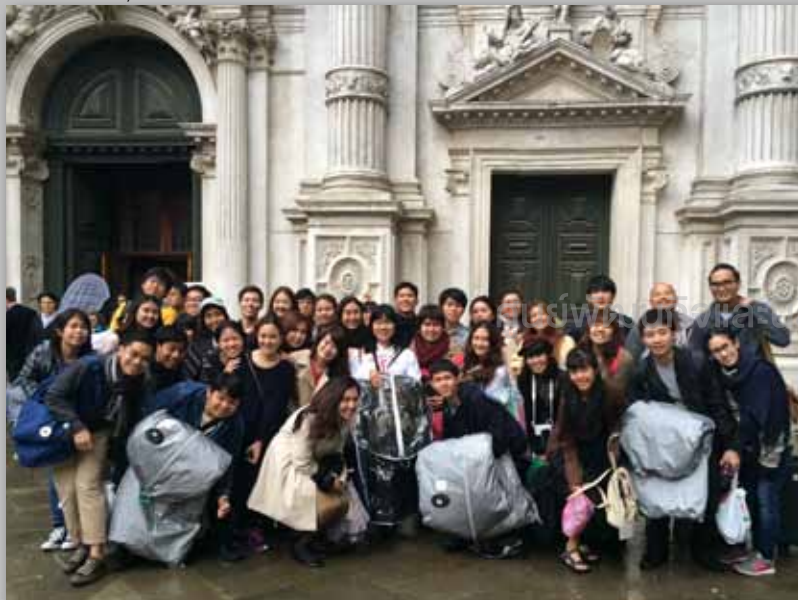
ฝนตกหนักในการแสดงคอนเสิร์ต ณ นครเวนิส

ประทานอาหารเที่ยง จากนั้นซ้อมในห้องที่ใช้ในการแข่งขันเพื่อให้ชินกับอคูสติคของห้อง แต่ละวงมีเวลาซ้อม ๑๐ นาที มีเจ้าหน้าที่ของผู้จัดการประกวดเป็นผู้กำกับเวลา อคูสติคของห้องประกวดแห่งนี้เสียงไม่ก้อง ทำให้การร้องเป็นไปได้ยากลำบากเนื่องจากนักร้องไม่ได้ยินเสียงของตนเองหรือของแนวเสียงอื่น ๆ นักร้องเกิดความเครียด ช่วงบ่ายจึงให้นักร้องรวมตัวกันกลางแจ้งเพื่อซ้อมในสภาพแวดล้อมที่การฟังลำบาก เพื่อให้ นักร้องคุ้นเคย ในระหว่างนั้น มีชาวเมืองเดินพลุกพล่าน เนื่องจากเป็นวันหยุดวันแรงงาน จึงได้รับความสนใจ