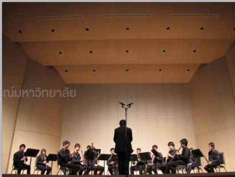
วงคลาริเน็ตบรรเลงที่หอแสดงดนตรีจุฬา