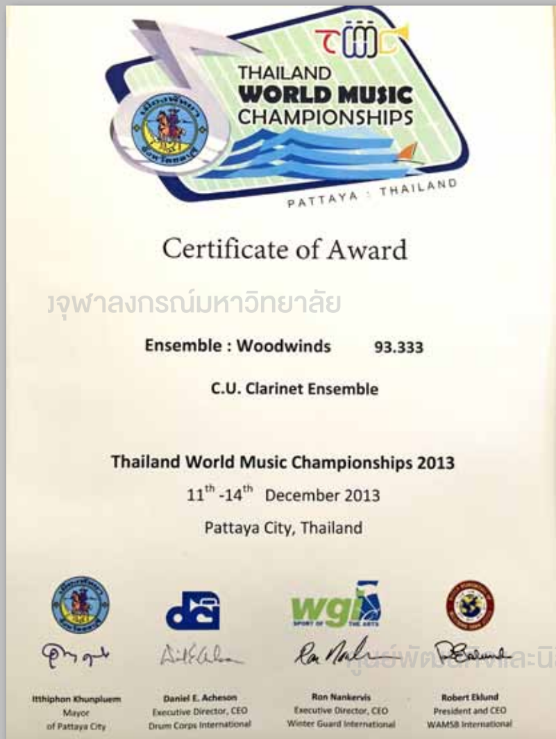
Certificate of Award Thailand World Music Championships

Venezia in Musica ที่เราเข้าประกวด เป็นการแข่งขันขับร้องประสานเสียงที่มีขึ้นติดต่อกันเป็นปีที่ ๑๒ โดย Meeting Music ร่วมกับเมืองคาร์โรว์ ซึ่งเป็นเมืองตากอากาศที่อยู่ห่างประมาณ ๔๕ นาทีโดยทางรถยนต์จากนครเวนิส มีการแบ่งประเภทของการแข่งขันตามอายุ ระดับความยากง่าย เครื่องดนตรีที่ใช้ประกวดในการแข่งขัน และจำนวนของนักร้องในวง