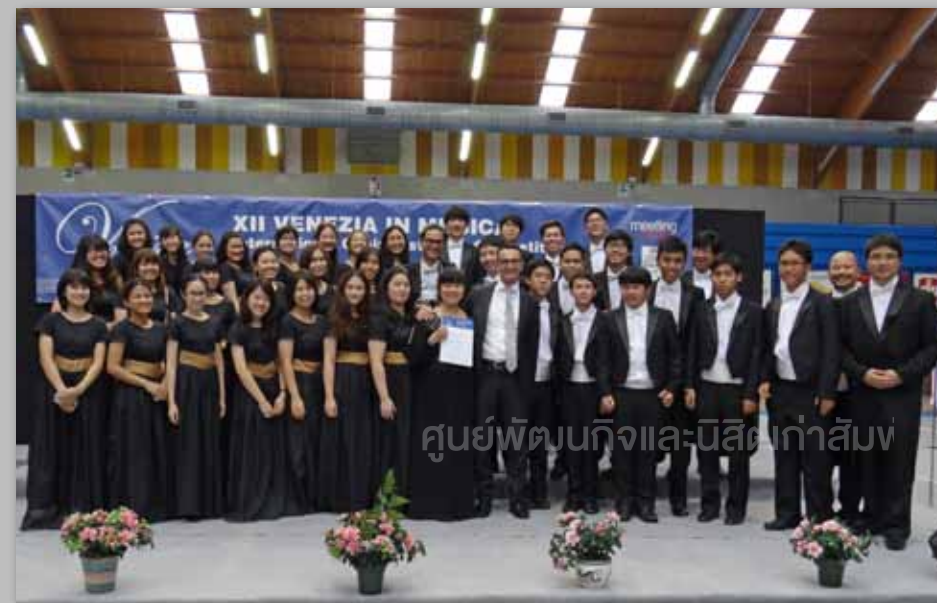
การประกวดในรอบ Grand Prize

หลังจากที่ได้ส่งประวัติของวงร่วมกับไฟล์เสียงจำนวน ๓ เพลงจากคอนเสิร์ตของวงฯ เมื่อเดือนมิถุนายน ๒๕๕๖ ที่ผ่านมา ทางผู้จัดก็ได้ตอบรับวง CUCC และโปรแกรมเพลงที่ใช้ในการแข่งขันก็ได้รับการอนุมัติจาก Artistic Committee และได้ทำการติดต่อในเรื่องของตารางเวลาและการจัดการมา