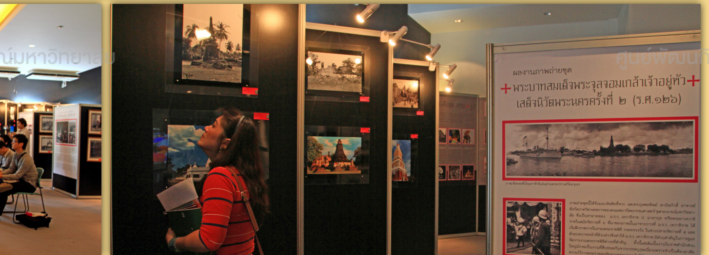
ศูนย์พัฒนกิจและนิสิตเก่าสัมพันธ์แห่งจุฬาลงกรณ์มหาวิทยาลัย