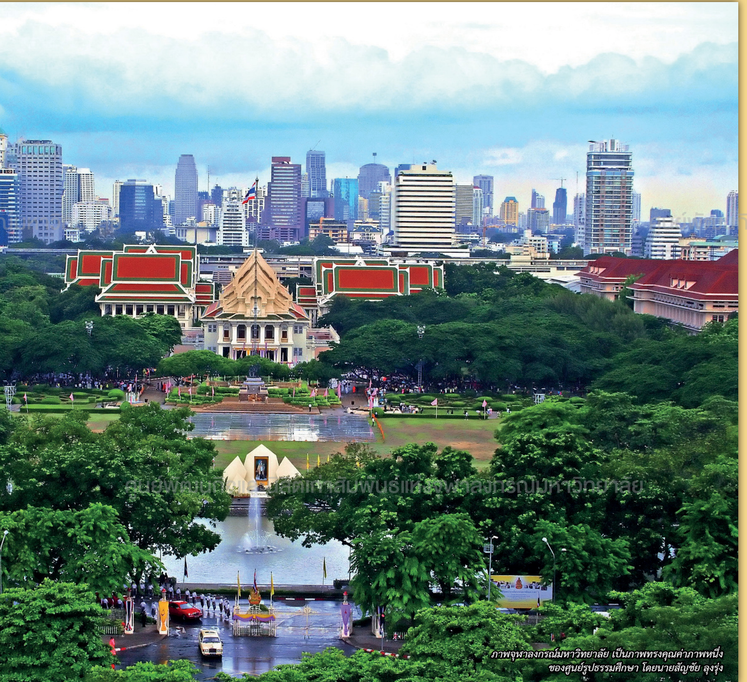
ศูนย์พัฒนกิจและนิสิตเก่าสัมพันธ์แห่งจุฬาลงกรณ์มหาวิทยาลัย