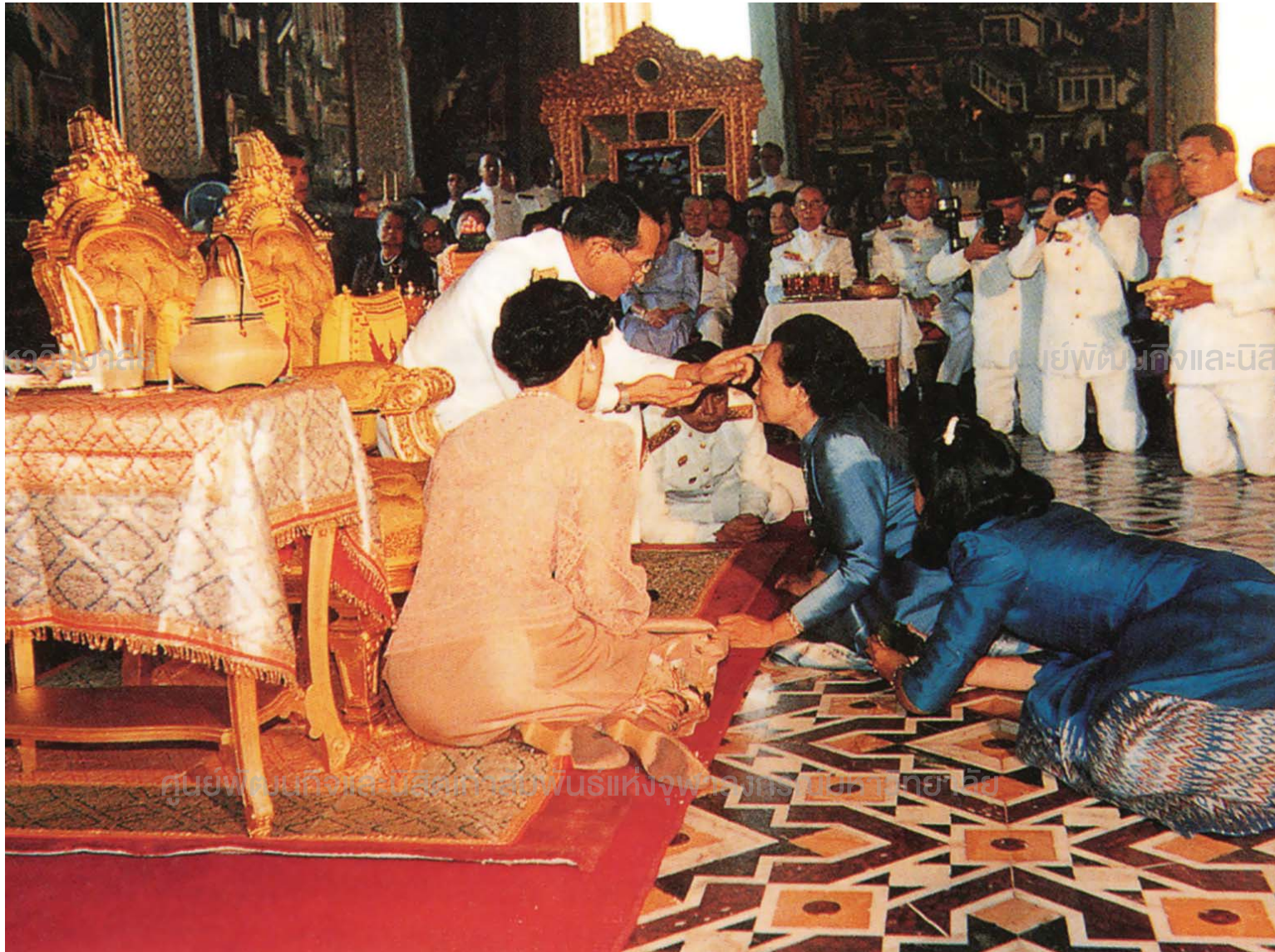
ศูนย์พัฒนกิจและนิสิตเก่าสัมพันธ์แห่งจุฬาลงกรณ์มหาวิทยาลัย