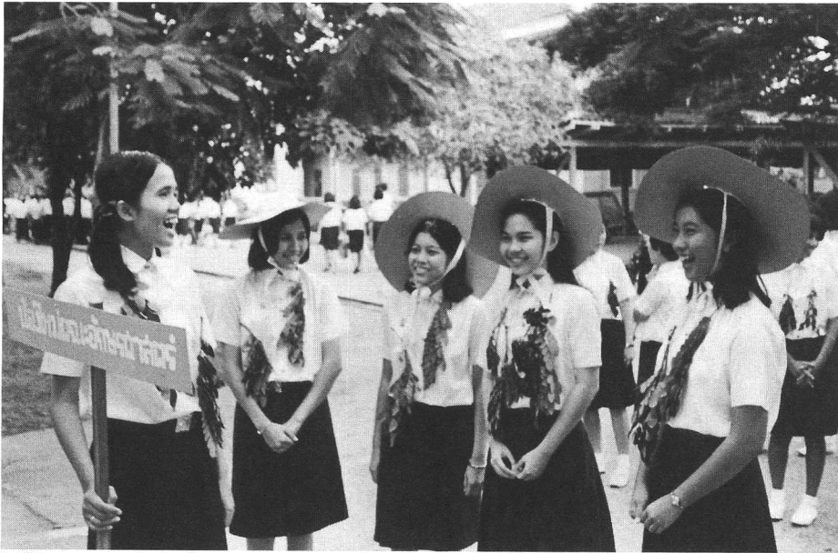
น้องใหม่จุฬาฯ รุ่นที่ ๕๐ ปี พ.ศ. ๒๕๑๐