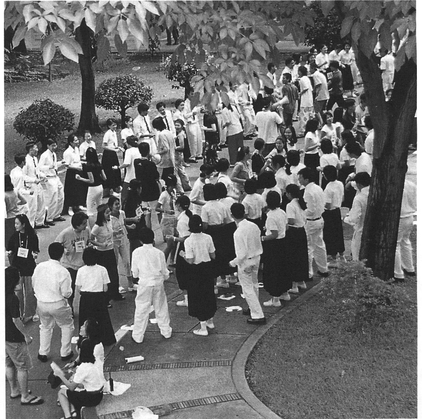
น้องใหม่จุฬาฯ รุ่นที่ ๘๕ ตามกลุ่มที่บ้านต่างๆ

รับนักเรียนได้มากขึ้น กิจกรรมรับน้องจึงมีกลุ่มนิสิตที่มาจากภูมิภาคต่างๆ รับน้องที่มีภูมิสำเนาต่างจังหวัด นิสิตรุ่นพี่ซึ่งมาจากโรงเรียนที่มีผู้สอบเข้าจุฬาฯได้มาก จึงจัดการรับน้องใหม่จากโรงเรียนของตน การจัดการแข่งขันกีฬาระหว่างคณะนำไปสู่การทะเลาะวิวาทมากขึ้นและรุนแรงมากขึ้น มหาวิทยาลัยจึงจัดตั้งองค์การบริหารกิจการนิสิตทำให้มีชมรมต่างๆ เพิ่มขึ้น การรับน้องใหม่ซึ่งเป็นสมาชิกของชมรมจึงเกิดขึ้น กิจกรรมรับน้องใหม่จึงมีมากและกินเวลาสำหรับจัดกิจกรรมต่างๆ มากกว่าเดิม