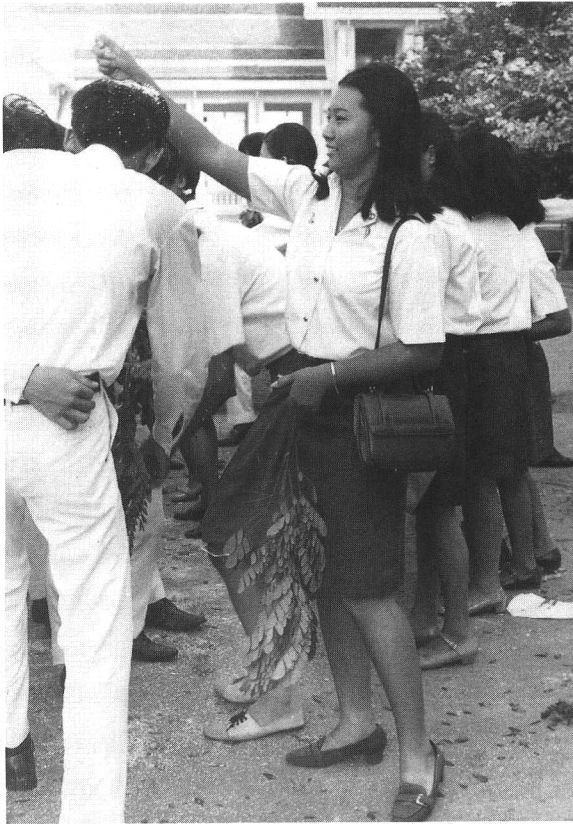
รุ่นพี่สมัยก่อนสวมรองเท้าปิดหน้าปิดหลัง