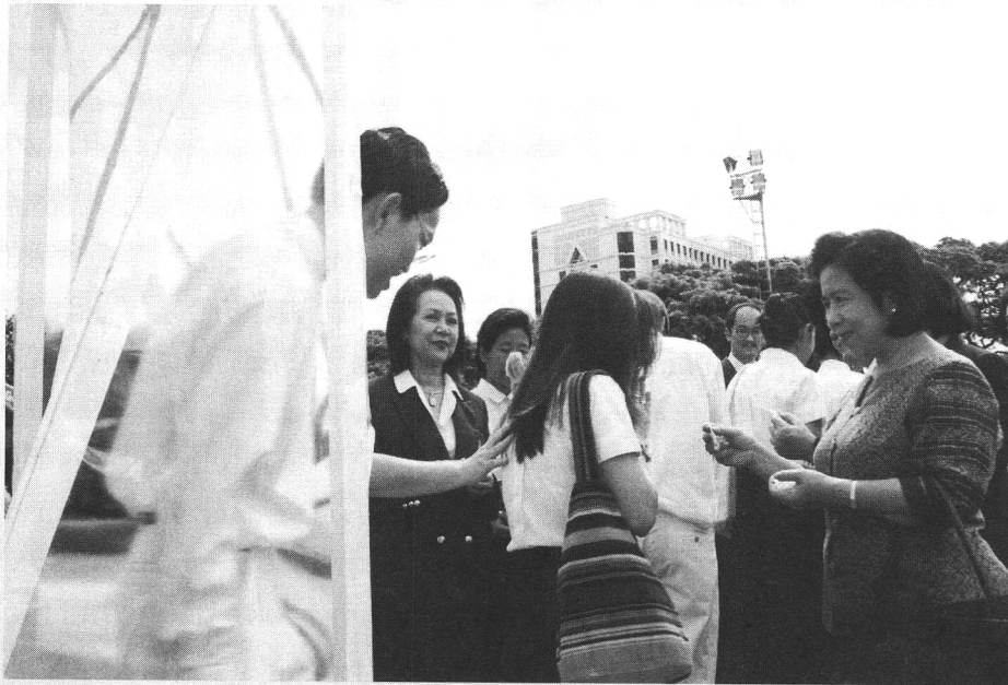
น้องใหม่จุฬาฯ รุ่นที่ ๔๕ ปี พ.ศ. ๒๕๔๕

ต่อมานิสิตที่วิทยาเขตปทุมวัน (นิสิตคณะวิศวกรรมศาสตร์กับนิสิตคณะอักษรศาสตร์และวิทยาศาสตร์) นิสิตวิทยาเขตวังหลวง (คณะรัฐประศาสนศาสตร์) ได้จัดงานรับน้องใหม่สำหรับนิสิตที่วิทยาเขตปทุมวัน ซึ่งเรียนที่ “วังใหม่” หรือ “วังกลางทุ่ง” หรือ “วังวินด์เซอร์” (วังของสมเด็จพระบรมโอรสาธิราช เจ้าฟ้ามหาวชิรุณหิศ สยามมกุฎราชกุมารพระองค์แรก ซึ่งทรงเป็นสมเด็จพระปิตุลาหรือลุงในพระบาทสมเด็จพระเจ้า-