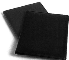
สมุดบันทึกสำหรับการสนับสนุน ที่ชำระเงินล่วงหน้า ๑,๐๐๐ บาท ขึ้นไป