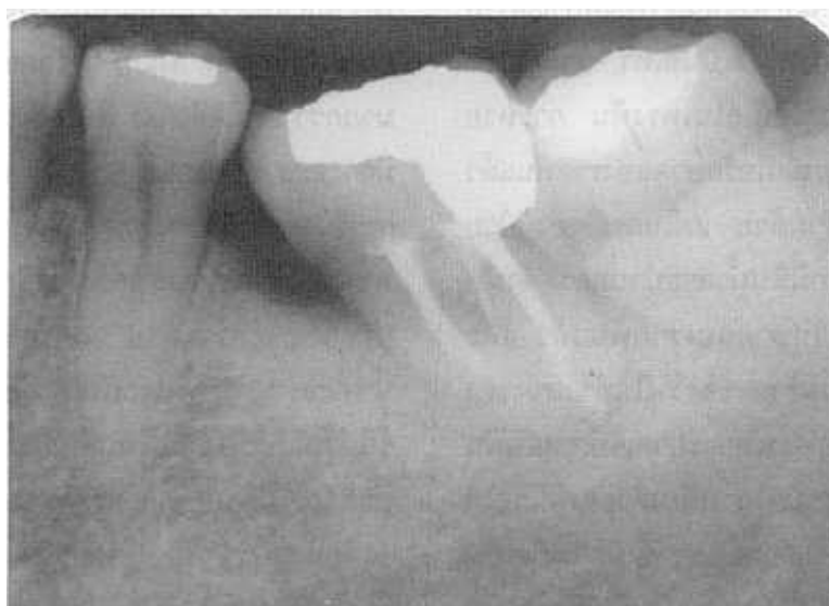
รูปที่ 4 ภาพรังสีติดตามผล 1 ปี 6 เดือน หลังการรักษาคลองรากฟัน แสดงให้เห็นว่า รอยโรคหายไป และอวัยวะปริทันต์มีสภาพปกติ Fig. 4 one and a half year recall radiograph shows no sign of periapical pathosis and periodontium in normal state