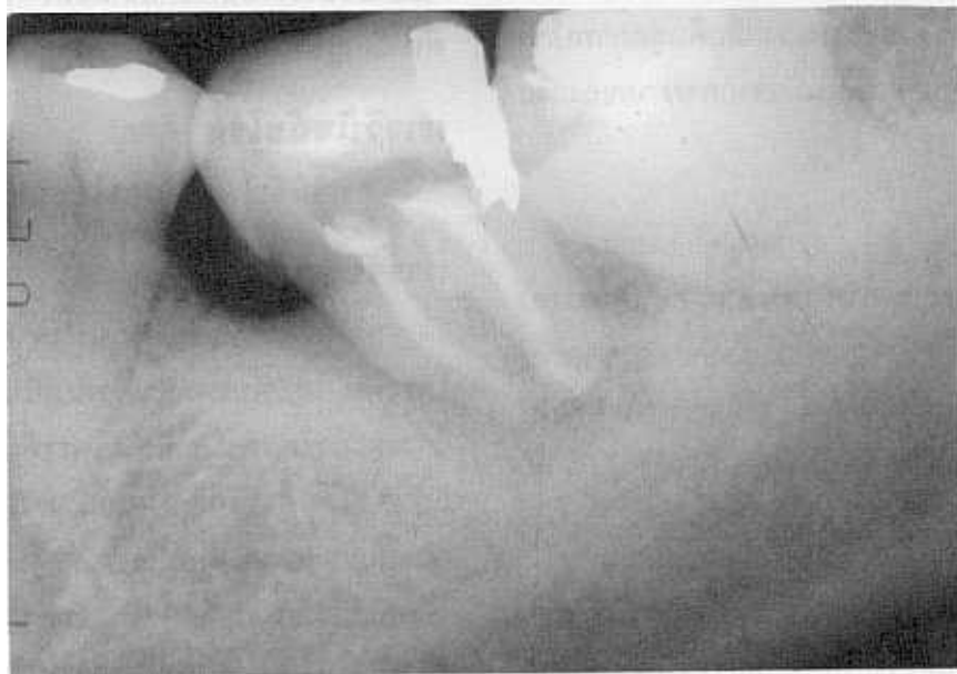
รูปที่ 2 ภาพรังสีหลังจากการอุดคลองรากฟัน

Fig. 1 Preoperative radiograph of mandibular left second molar with severe localized alveolar bone loss (the radiographic image has the same appearance as an intrabony periodontal defect) and calculus at cemento- enamel junction on mesial surface.