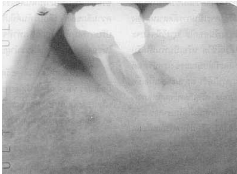
รูปที่ 3 ภาพรังสีติดตามผล 6 เดือนหลังการรักษาคลองรากฟัน แสดงให้เห็นว่า มีการสร้างกระดูกขึ้นรอบรากฟัน Fig. 3 6 months recall radiograph shows apical bone regeneration.

จากการติดตามผลเป็นเวลา 1 ปี 6 เดือน พบว่าร่องลึกปริทันต์ด้านแก้มไกลกลางและด้านล้นไกลกลางลึก 4 มิลลิเมตร ในตำแหน่งอื่นรอบซี่ฟันลึก 3 มิลลิเมตร ภาพรังสี พบว่ากระดูกงอกขึ้นโดยรอบซี่ฟันเป็นปกติ (รูปที่ 4)