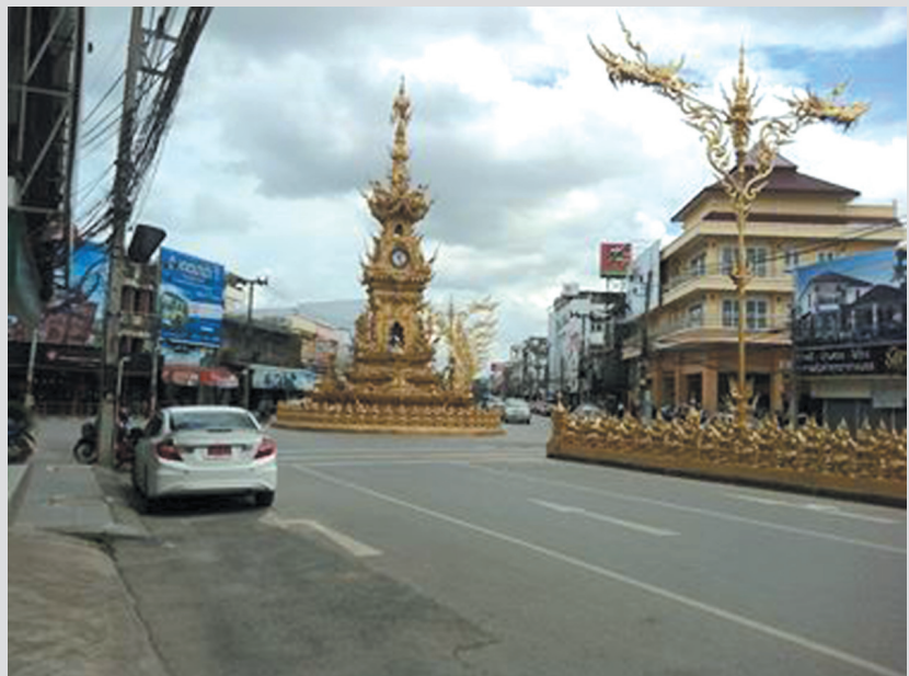
แลนด์มาร์ค (landmark) แสดงอัตลักษณ์ของเมืองเชียงราย ออกแบบโดยอาจารย์เฉลิมชัย โฆสิตพิพัฒน์