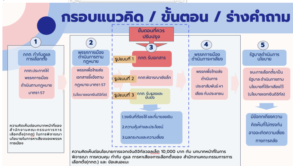
รูปภาพที่ 1 กรอบแนวคิดงานวิจัย