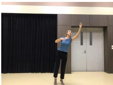
ภาพที่ 3 แรงขับเคลื่อนทางกายภาพร่อนขึ้นไป

2.3 การร่อนขึ้นไป (glide) ประกอบด้วย เบา (light) ฟุ่งตรง (direct) และช้า (sustain)