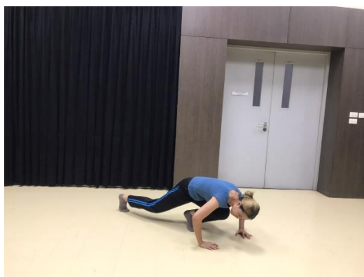
ภาพที่ 8 แรงขับเคลื่อนทางกายภาพกด

2.8 กด (press) ประกอบด้วย หนัก (strong) พุ่งตรง (direct) และช้า (sustain)