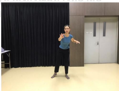
ภาพที่ 5 แรงขับเคลื่อนทางกายภาพตะ

2.5 ตะ (dab) ประกอบด้วย เบา (light) ฟุ่งตรง (direct) และเร็ว (quick)