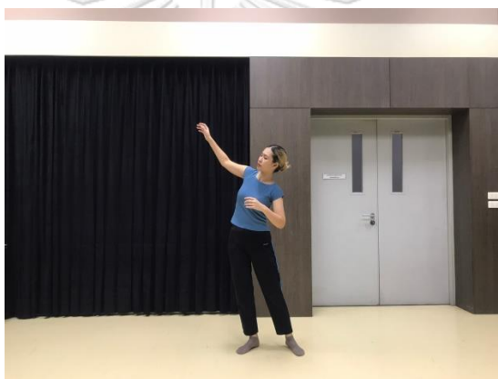
ภาพที่ 7 แรงขับเคลื่อนทางกายภาพสะบัด

2.7 สะบัด (flick) ประกอบด้วย เบา (light) ไม่มีทิศทาง (indirect) และเร็ว (quick)