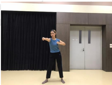
ภาพที่ 2 แรงขับเคลื่อนทางกายภาพต่อย

2.2 ต่อย (punch) ประกอบด้วย หนัก (strong) พุ่งตรง (direct) และเร็ว (quick)