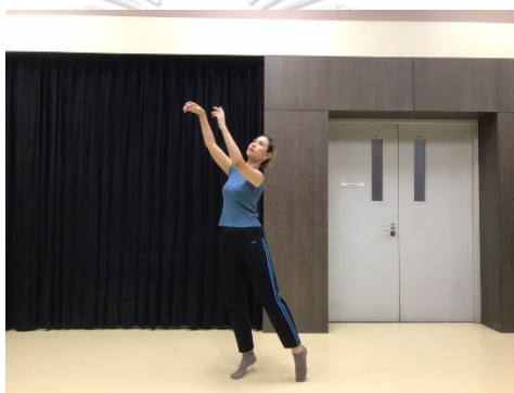
ภาพที่ 1 แรงขับเคลื่อนทางกายภาพล่องลอย

2.1 ล่องลอย (float) ประกอบด้วย เบา (light) ไม่มีทิศทาง (indirect) และช้า (sustain)