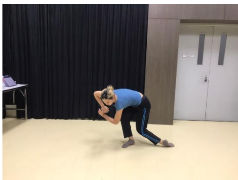
ภาพที่ 6 แรงขับเคลื่อนทางกายภาพบิด

2.6 บิด (wring) ประกอบด้วย หนัก (strong) ไม่มีทิศทาง (indirect) และช้า (sustain)