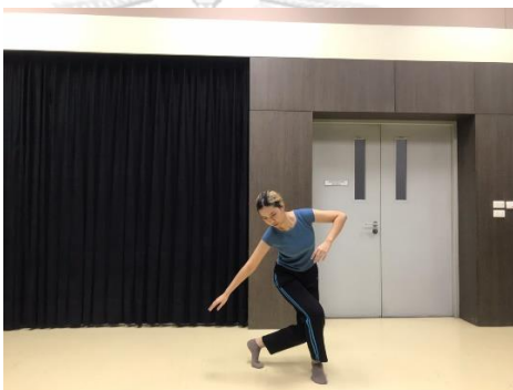
ภาพที่ 4 แรงขับเคลื่อนทางกายภาพเฉือน

2.4 เฉือน (slash) ประกอบด้วย หนัก (strong) ไม่มีทิศทาง (indirect) และเร็ว (quick)