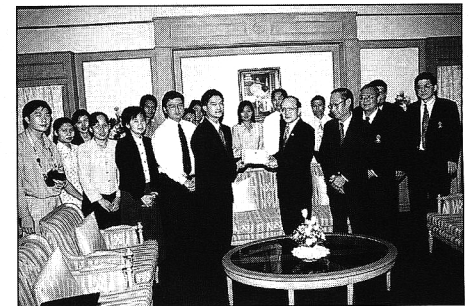
กรรมการบัณฑิต ปีการศึกษา ๒๕๓๙- ๔๐ มอบรายได้ที่เหลือ ให้เป็นทุนวิจัยของ มหาวิทยาลัย