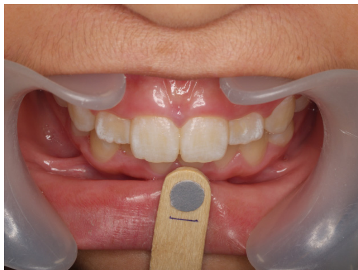
รูปที่ 1 กระดาษสีเทาระดับความเข้มร้อยละ 18 ใช้เป็นมาตรฐานเพื่อปรับสีของภาพ

ปริมาณของยาสีฟันที่ใช้ในแต่ละครั้ง ได้กำหนดให้เด็กบิบบายสีฟันเท่ากับความยาวหน้าตัดแปรง หรือยาวประมาณ 1 นิ้ว ซึ่งจะมีปริมาณฟลูออไรด์ 1 มิลลิกรัมในยาสีฟันฟลูออไรด์ 1000 ส่วนในล้านส่วน 27