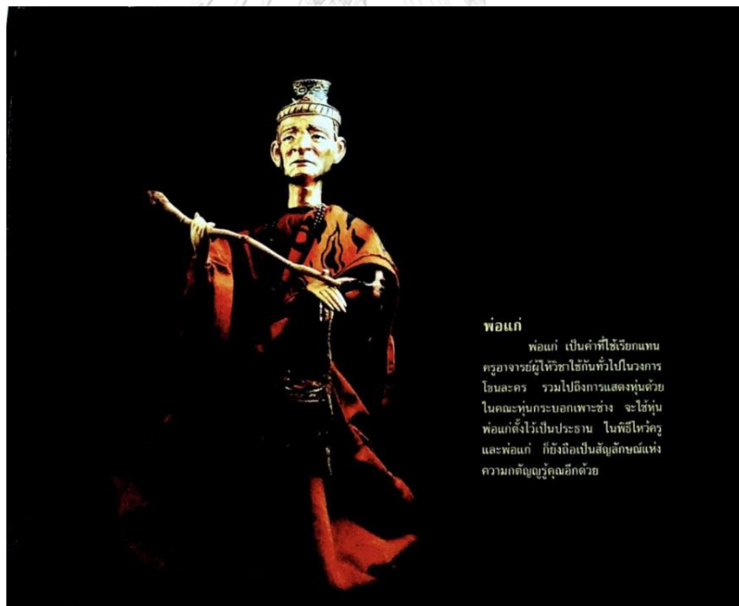
ภาพที่ 5 ตัวหุ่นกระบอก พ่อแอก