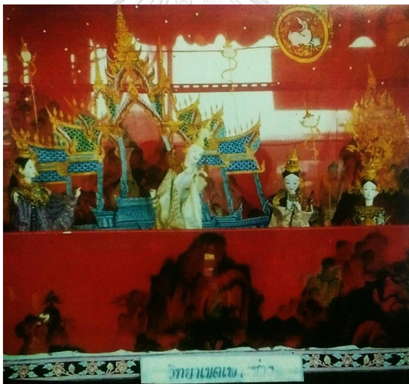
ภาพที่ 3 การแสดงหุ่นคณะเพาะช่างที่มาภาพ