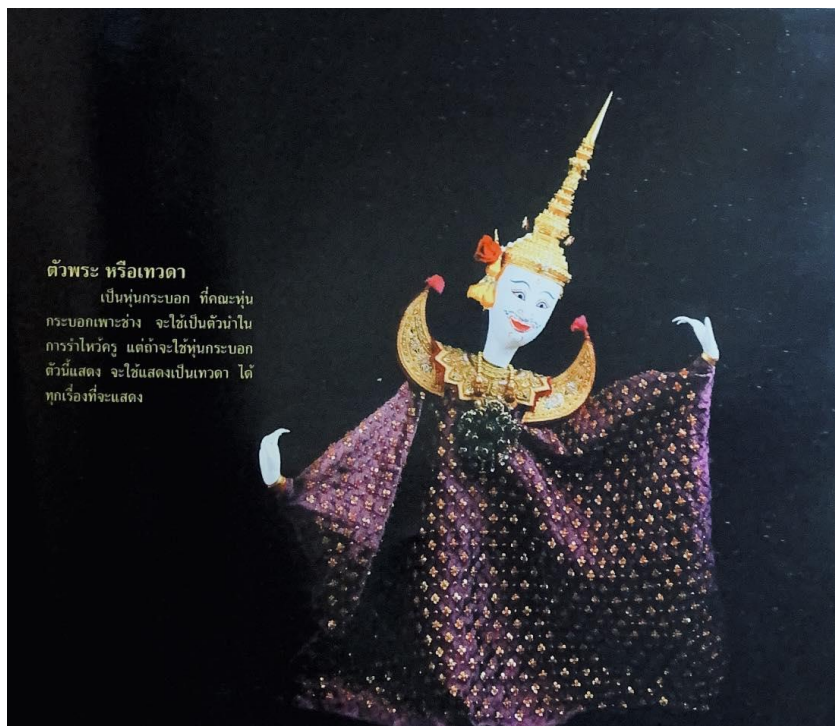
ตัวพระ หรือเทวดา เป็นหุ่นกระบอก ที่คณะหุ่น กระบอกพะเยาช่าง จะใช้เป็นตัวนำใน การรำไหว้ครู แต่ถ้าจะใช้หุ่นกระบอก ตัวนี้แสดง จะใช้แสดงเป็นเทวดา ได้ ทุกเรื่องที่จะแสดง