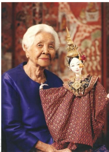
ภาพที่ 2 ครูชิ้น สกุลงิ้ว (ศิลปินแห่งชาติ) และหุ่นกระบอกตัวนาง