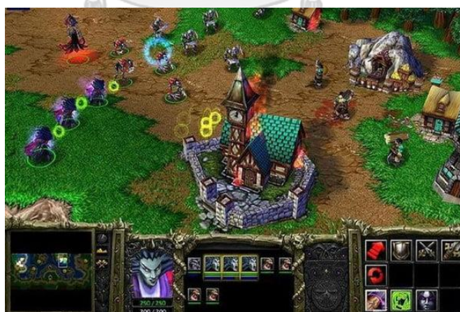
รูปภาพที่ 5 เกม Warcraft 3

โดยเกมประเภทนี้จะจำลองการยิงจากมุมมองบุคคลที่หนึ่ง และในการแข่งขันอาจเป็นไปได้ทั้งประเภทบุคคลหรือประเภททีม เป็นเกมประเภท Action มักจะแสดงแขนของตัวละครให้เห็นผ่านหน้าจอโดยจะจำลองการเคลื่อนไหวของมนุษย์เพื่อให้เกมออกมาสมจริงที่สุด (Techopedia, 2019) ยกตัวอย่างเช่น Pub g, Counter strike, Overwatch เป็นต้น