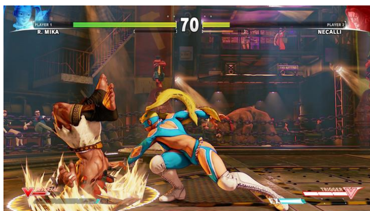
รูปภาพที่ 3 เกม Street Fighter V