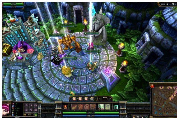
รูปภาพที่ 6 เกม Dota

เกมประเภทนี้สามารถเรียกได้ว่าเป็นเกมยอดนิยมประเภทหนึ่ง โดยตัวเกมจะจำลองสถานการณ์โดยผู้เล่นจะต้องวางแผนกลยุทธ์เพื่อการเอาชนะคู่ต่อสู้ (Churchill, 2012) เป็นแนวเกมที่ได้รับคามนิยมมากในช่วง 5-6 ปีก่อน เช่น WarCarf, StarCarft, Battle Realms แต่ในปัจจุบันเกมประเภทนี้เริ่มจะมีบทบาทน้อยลง