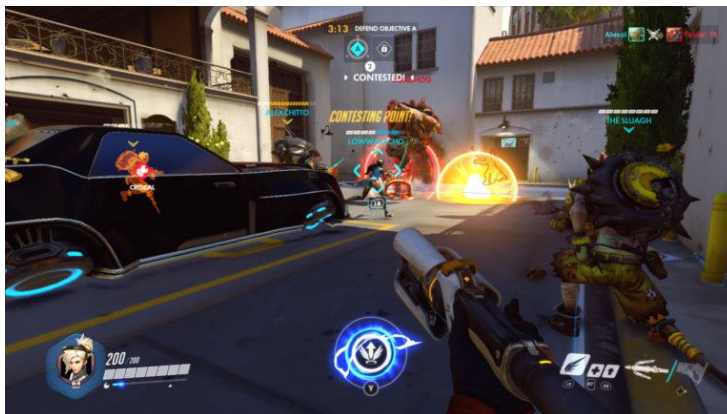
รูปภาพที่ 4 เกม Overwatch