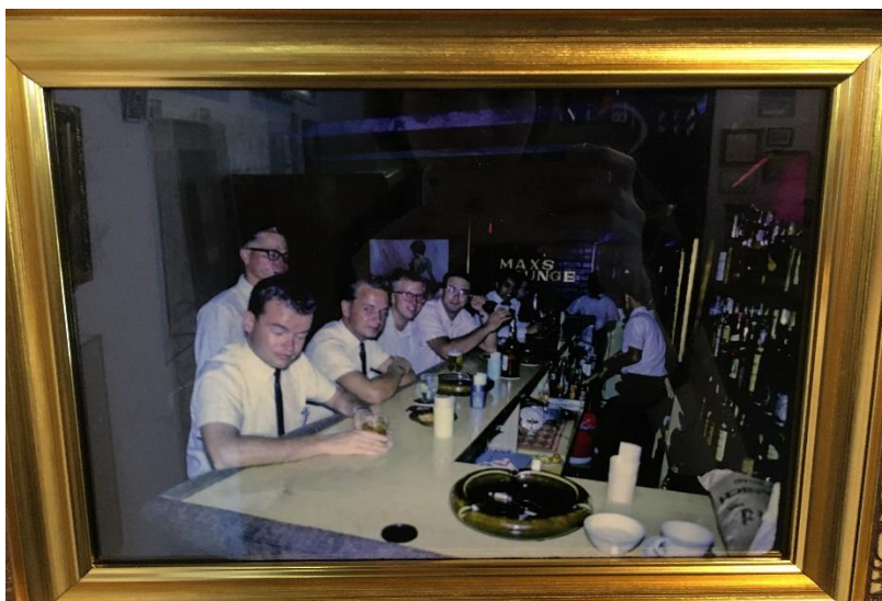
ภาพที่ 4 เจ้าหน้าที่หน่วยข่าวกรองที่มาพบปะกันในบาร์แห่งหนึ่งย่านพัฒน์พงษ์

ประโยชน์จากความเป็นหญิงของผู้หญิงบริการที่คนทั่วไปมักจะมองว่าไม่มีความเกี่ยวข้องประเด็นความมั่นคงในการดำเนินยุทธศาสตร์ความมั่นคงอีกด้วย