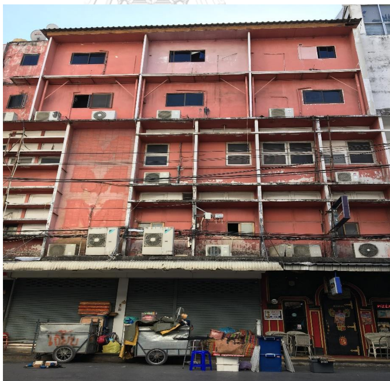
ภาพที่ 5 อาคารพาณิชย์ในซอยพัฒน์พงษ์ที่ในอดีตเคยเป็นบาร์อะโกโกและเป็นฐานปฏิบัติการลับของหน่วยข่าวกรองสหรัฐฯ ปัจจุบันกลายเป็นร้านพิซซ่าและโรงแรมขนาดเล็ก