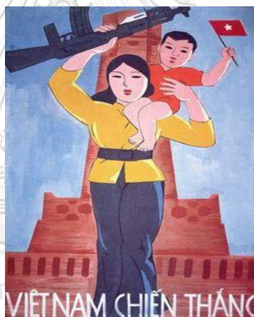
ภาพที่ 2 ภาพโฆษณาชวนเชื่อในเวียดนามเหนือที่แสดงถึงบทบาทหน้าที่ของผู้หญิงในช่วงสงครามเวียดนาม

เห็นว่าการต่อสู้ของหญิงเวียดนามดำเนินควบคู่ไปกับบทบาทหน้าที่ของการเป็นหญิง ผู้หญิงไม่จำเป็นต้องเลือกและไม่ต้องการเลือกระหว่างความเป็นแม่กับความเป็นนักรบ 310 หรือจริง ๆ แล้วพวกเธอเลือกไม่ได้เลยจำเป็นที่จะต้องเป็นทั้งสองอย่าง การสร้างภาพและยกย่องผู้หญิงที่ “มือก็ไกวดาบก็แกว่ง” คือการโฆษณาให้ผู้หญิงปรารถนาหรือจำยอมแบกรับภาระที่เพิ่มขึ้น จากที่เคยเลี้ยงลูก ดูแลบ้าน ดูแลครอบครัว พวกเขาต้องออกมาถือปืนต่อสู้กับกองทัพต่างชาติที่เป็นศัตรูโดยที่ยังต้องทำหน้าที่แม่และภรรยาภายในบ้านเหมือนเดิม การลุกขึ้นจับอาวุธของผู้หญิงไม่ได้ทำให้เธอทิ้งใครไว้ข้างหลังต่างจากผู้ชายที่เมื่อเวลาออกไปต่อสู้พวกเขาสามารถละทิ้งครอบครัว ลูก และภรรยาไว้เบื้องหลังได้ นี่เป็นอีกหนึ่งตัวอย่างที่ชี้ให้เห็นว่าผู้หญิงกระบวนกรยุทธธาภิวัตน์หรือกระบวนกรผลิตซ้ำที่ถูกทำให้เป็นเรื่องของทหารส่งผลต่อผู้หญิงในการเป็นผู้แบกรับภาระทั้งภายในพื้นที่ส่วนตัวและในพื้นที่สาธารณะ และพื้นที่สาธารณะนั้นไม่ได้หมายถึงตลาด สถานประกอบการ หรือที่ทำงานเพียงอย่างเดียว แต่หมายรวมถึงสนามรบซึ่งเคยถูกสงวนไว้ว่าเป็นพื้นที่ของนักรบชายโดยเฉพาะด้วย