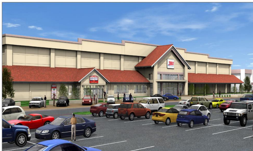
ภาพที่ 3 ร้านค้าสวัสดิการของกองทัพบกและกองทัพอากาศ (Army and Air Force Exchange Service: AAFES) ในฐานทัพของกองทัพอากาศสหรัฐในเมืองโอกินาวา ประเทศญี่ปุ่น

อย่างไรก็ตามความสัมพันธ์ระหว่างกองทัพและภรรยาทหารไม่ได้เป็นความสัมพันธ์ที่ราบรื่นเสียทีเดียวนัก ปัญหาการหย่าร้างของครอบครัวทหารส่งผลต่อภาพลักษณ์ของกองทัพเมื่อผู้หญิงกลุ่มหนึ่งที่เป็นทั้งภรรยาและอดีตภรรยาออกมาเรียกร้องในสิ่งที่พวกเธอเห็นว่าไม่เป็นธรรม การหย่าร้างกับสามีทหารทำให้พวกเธอต้องแบกภาระในสิ่งที่กองทัพเคยจัดสรรไว้ให้เป็นสวัสดิการของครอบครัวทหาร มุมมองของผู้หญิงที่เห็นว่าประเด็นดังกล่าวไม่เป็นธรรมเพราะที่ผ่านมาในระหว่างที่ชีวิตสมรสของพวกเธอยังอยู่ พวกเธอดูแลสามีจนก้าวหน้าในหน้าที่การงาน ประคับประคองสามีที่กลับมาจากสนามรบพร้อมบาดแผลทางร่างกายและจิตใจ อุทิศตนทำงานที่ไม่ได้รับค่าจ้างของกองทัพ แต่เมื่อถึงวันที่ต้องหย่าร้างพวกเธอไม่ได้สูญเสียแค่สามีแต่ยังเสียสวัสดิการด้านต่าง ๆ เช่น บ้าน การรักษาพยาบาล ส่วนลดในร้านค้าสวัสดิการ นั่นทำให้ในเวลาต่อมารัฐบาลมีการสั่งการให้กองทัพเปลี่ยนกฎเกณฑ์สำหรับภรรยาและอดีตภรรยาของทหาร แต่อย่างไรก็ตามกองทัพเริ่มเห็นแล้วว่าภรรยาทหารมีโอกาที่จะเป็นตัวปัญหา ดังนั้นกองทัพจึงพยายามจัดการกับปัญหาโดยการปรับมโนทัศน์ที่ใช้ในการสร้างฐานทัพในต่างแดนฐานทัพแบบใหม่ขึ้นมาเรียกว่า เดอะ ลิลี่ แพด (the lily pad) ลักษณะของลิลี่ แพด ได้แก่ ที่พักอาศัยไม่ใช่ที่พักเขตชานเมือง ไม่มีสนามหญ้า ไม่มีสิ่งอำนวยความสะดวกหรือสันทนาการต่าง ๆ เช่น ดิสโก ลานโบว์ลิ่ง หรือสนามกอล์ฟให้ทหารได้ผ่อนคลาย และที่สำคัญคือไม่มีภรรยา 322 สิ่งนี้แสดงให้เห็นว่ารัฐบาลมองว่าภรรยาทหารเป็นปัญหาดังนั้นการตัดภรรยาออกคือการแก้ปัญหาที่ง่ายและเร็วที่สุด