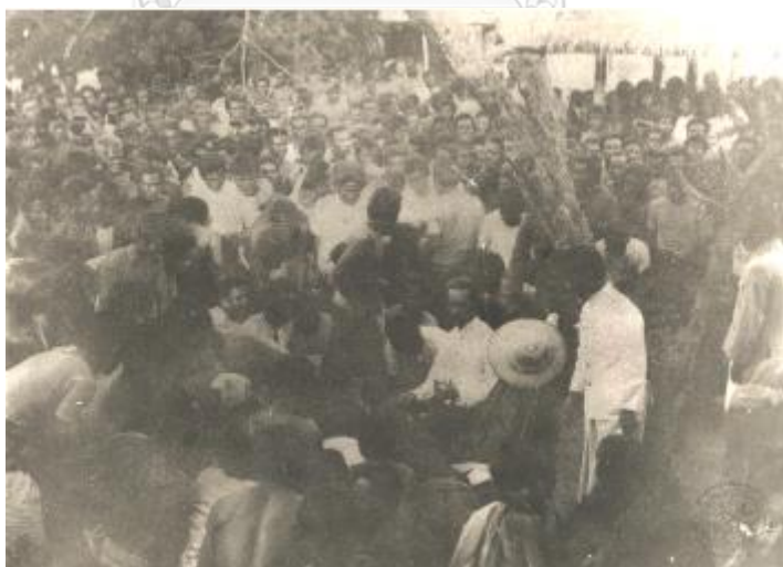
ภาพที่ 3 สมเด็จฯ กรมพระยาดำรงราชานุภาพท่ามกลางบรรดาราษฎรสยาม (หจข, รหัส 69M00025)

การเดินทางตรวจราชการหัวเมืองจตุรงหมายประการสำคัญคือเป็นเครื่องมือในการเสริมสร้างประสิทธิภาพการปกครองในช่วงที่รัฐสยามกำลังสร้างระบบราชการขึ้นใหม่ที่ยังไม่แข็งแรงมากพอ นอกเหนือจากกลุ่มผู้ปกครองและข้าราชการท้องที่แล้ว ยังมีกลุ่มคนในปกครองของสยามที่ไม่ใช่ข้าราชการแต่หมายรวมถึงราษฎร และกลุ่มคนที่อยู่นอกการควบคุมที่รัฐต้องดึงให้เข้ามาเป็นส่วนหนึ่งภายใต้การปกครองระบบใหม่ นอกจากนี้การสานสัมพันธ์กับผู้คนเหล่านี้ยังช่วยให้รัฐมีหูมีตาอยู่ในพื้นที่ห่างไกล รัฐสยามในช่วงเวลานี้จึงให้ความสนใจในการแยกแยะและสร้างสัมพันธ์ตลอดจนจัดการปัญหาต่างๆของผู้คนในปกครอง