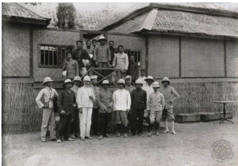
ภาพที่ 1 ถ่ายรูปหมู่ขณะตรวจราชการหัวเมืองในพื้นที่มณฑลแถบอีสานของสมเด็จพระยา ดำรงราชานุภาพและผู้ติดตาม

นอกจากสมเด็จพระยาดำรงฯแล้ว ข้าราชการส่วนกลางที่มีบทบาทสำคัญในการตรวจราชการในช่วงเวลานี้อีกคนหนึ่ง คือ พระยามหาอำมาตยาธิบดี(เส็ง วิริยศิริ) ซึ่งมีอำนาจสั่งราชการ การจัดการและการตรวจราชการหัวเมืองรองลงมาจากเสนาบดีกระทรวงมหาดไทย ตั้งแต่ทศวรรษ 2430 พระยามหาอำมาตย์ฯ มีโอกาสตามเสด็จฯ สมเด็จพระยาดำรงฯ ไปตรวจราชการหัวเมืองครั้งแรกในพื้นที่ราบลุ่มภาคกลาง หัวเมืองปักษ์ใต้และแหลมมลายู เมื่อถึงทศวรรษ 2440 พระยามหาอำมาตย์ฯ ยังดำรงบทบาทสืบเนื่องต่อมาโดยเริ่มจากการตรวจราชการหัวเมือง