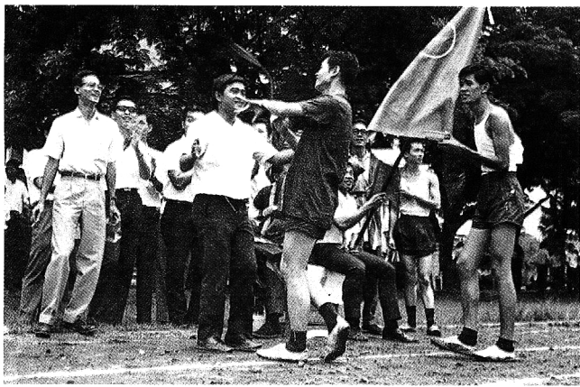
“กรีฑาน้องใหม่” รองผู้ว่าฯ จังหวัดอำนาจเจริญ กำลังรับป้อมอยู่ (ทั้งวิ่งทั้งรำ)