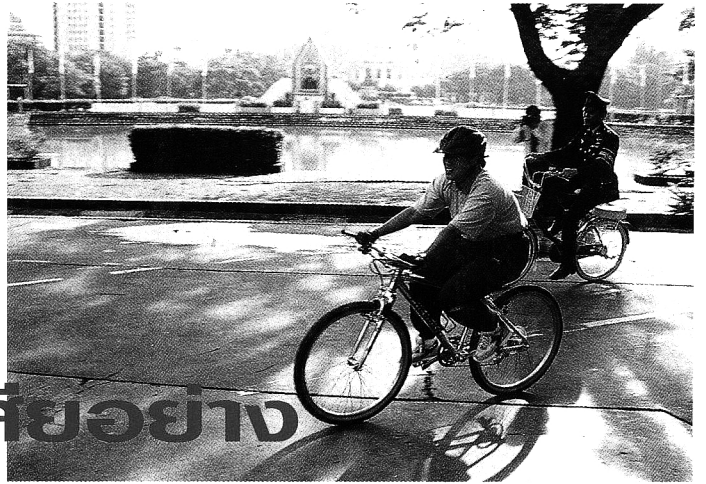
สมเด็จพระเทพรัตนราชสุดาฯ สยามบรมราชกุมารี เสด็จเป็นประธาน ในการแข่งขันจักรยานแวลลี เพื่อกองทุนบรมราชกุมารี

ก าเอาแต่ชื่อ คงจะเกี่ยวข้องกับเรื่องราวต่าง ๆ มากมายที่เป็นไปในรั้วและข้างรั้วจุฬาลงกรณ์ฯ นี้ แต่สิ่งที่อยากนำมาเล่าในครั้งนี้เป็นเรื่องของกีฬาในสนามของจุฬาลงกรณ์มหาวิทยาลัย หลายยุคหลายสมัยที่ผ่านมา “กีฬาก็ยังเป็นอะไร ๆ ของคนทุก ๆ คนในจุฬาฯ อันหมายถึงตั้งแต่เป็นหัวอกหัวใจ (ของคนบ้ากีฬา คนสอนและดูแลกีฬา คนเล่นกีฬา คนเชียร์กีฬา ฯลฯ) เป็นสื่อกลางแห่งชีวิตอนาคตของชาวจุฬาฯ หลาย ๆ คู่ (ของนักกีฬากับกองเชียร์คณะตัวเอง ของนักกีฬากับนักกีฬา ของนักกีฬากับคู่ต่อสู้คือต่างคณะ กองเชียร์กับกองเชียร์ กองเชียร์กับนักกีฬาคณะคู่ต่อสู้ ฯลฯ) เป็นไม้เปือไม้เมา (ของคณาจารย์ผู้ไม่พิศวาสกีฬาหลาย ๆ ท่าน ของน้องใหม่ หลาย ๆ คนที่ไม่ชอบเล่นกีฬาแต่พี่ ๆ ก็บังคับ ของพี่ ๆ สาว ๆ หลายคนที่ไม่ชอบซ้อมแต่อยากลงแข่งเลยก็ทำให้น้องใหม่หลาย ๆ คนที่เพียรซ้อมมาทั้งปีต้องกินฝุ่นที่ไหลเหมือนปีที่แล้วอีกตามเคย ฯลฯ) แล้วกีฬาก็ยังเป็นอะไรอีกมากมายที่เกินจะคาดคิดในชีวิตของชาวจุฬาฯ