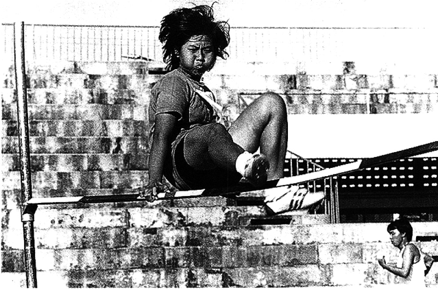
กีฬากลางแจ้ง กำลังเบ่งลมลอยตัวข้ามคาน กรุณาติดต่อ "จามจุรี" ด้วยครับ มีรางวัลให้ครับ

การแข่งขันกีฬาแต่ละประเภทมักจะไม่ใช่ช้อมกัน เพราะเห็นใจบางคนซึ่งนักกีฬาหน้าน้อยหาทำยากหรือเรียวยแรงไม่ค่อยมี ประกอบกับกองเชียร์ก็ไม่สามารถวิ่งรอกขนขววนไปเชียร์ทัน เพราะกองเชียร์ก็เป็นนักกีฬาอย่างอื่นอยู่ด้วย ต้องช้อมเสียก่อน แล้วจึงยกกองบางครั้งก็แถมด้วยซีโคลนมอมแมมไปเชียร์สาว ๆ คณะเราเชียร์ก็กันไปเพื่อให้คึกคัก ชุ่นใจ ก่อความสามัคคี เป็นกันเอง หรือจะเรียกว่าเป็นการใส่คะแนนให้กับตนเอง เมื่อสาวคณะคู่ต่อลุ่มมองมา อาจเกิด 'บึง' ขึ้นได้ ไม่ได้เชียร์ให้นักกีฬาอัดกันเหมือนสมัยหลัง ๆ และกองเชียร์ก็จะทำหน้าที่ล่อหน้างาม สร้างความประทับใจมากกว่าตาพ่อแม่ทั้งฝ่ายคู่แข่ง และฝ่ายตนเองเวลาเสียพนันอะไรพรรคินั้น