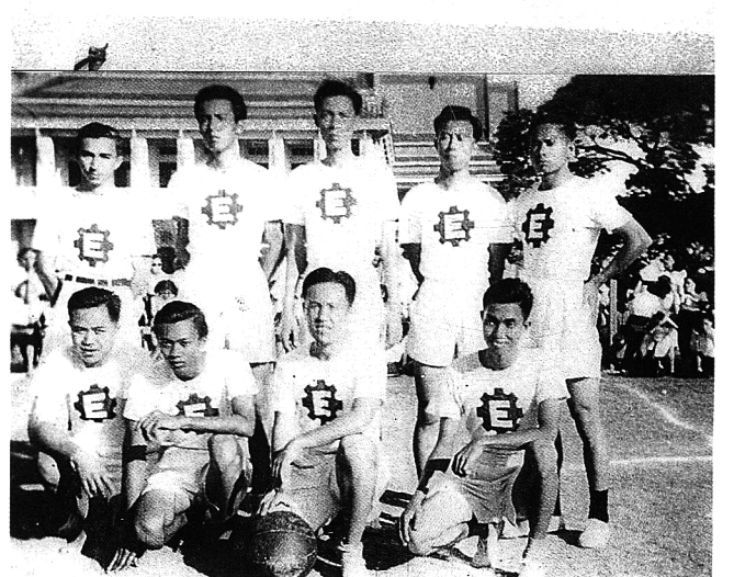
นักกีฬารุ่นคุณพ่อของผู้เขียน